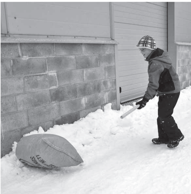
Nii käib kada ajamine.