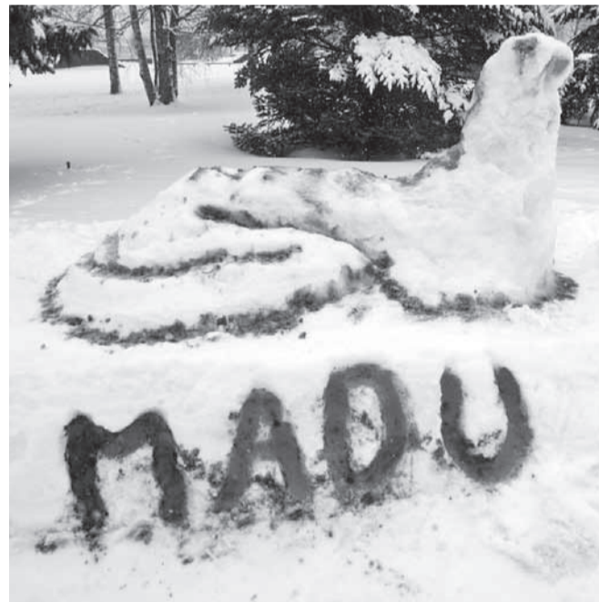
10. ja 11. klassi ühisloominguline madu.

omamoodi ilusad erilised lumemaod. Kui kujud olid valmis, läksid needki õpilased sööklasse oasuppi ja vastlakuklit sööma.