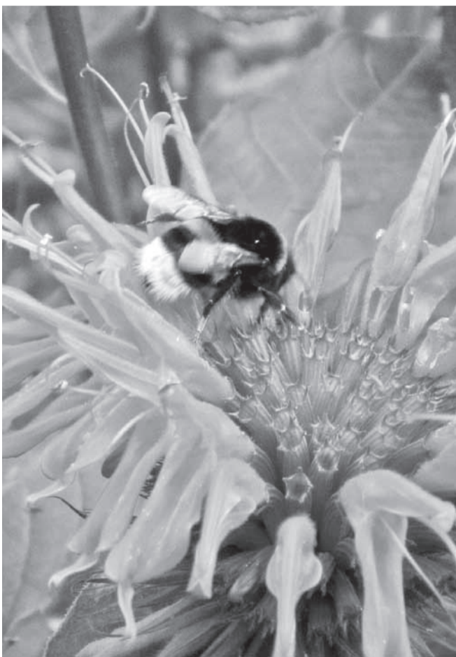
Ämmadest on ennegi abi olnud. Sünnipäevaks sulle lilleõis minu ämma aiast. Nagu näha, on ta loonud nii mõnedki töökojad – vähemalt mesilastele jagub tööd.

Küllap mul on midagi viga. Olen optimist. Hästi informeeritud. See tähendab – pessimist. Kellegi ütluse järgi pole pessimist muud kui hästi informeeritud optimist. Kes mind informeeris? Ise. Lugeses, kuulates, osaledes, elades. Kas see tähendab, et pessimistide kujunemise vältimiseks tuleks mitte huvituda, mitte osaleda... ?