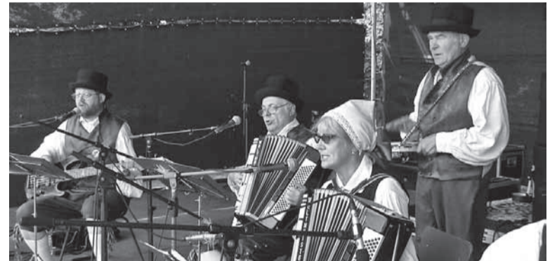
Suurüritusel löid aktiivselt kaasa ka Pilstvere Pillimehed.

ajaid, tänu kelle toetusele läksid päevad korda.