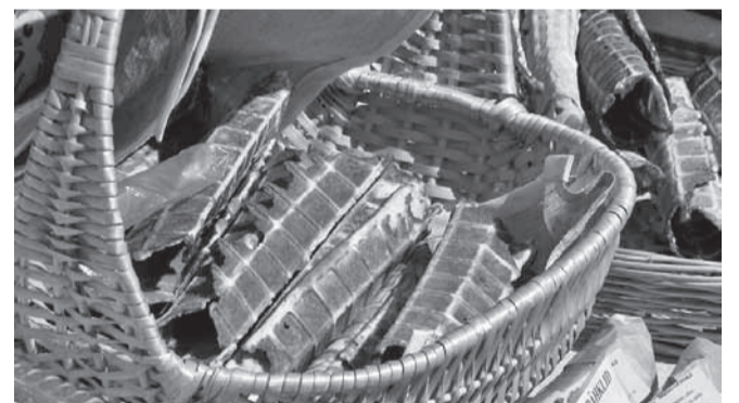
Kenas punutud korvis mõnusalt krõbedad vahvlitoruked.