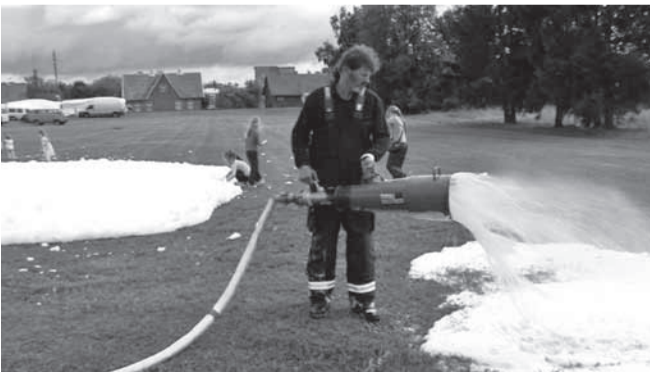
Esitlus päästetöötajalt – meelikõitev vahumõll.