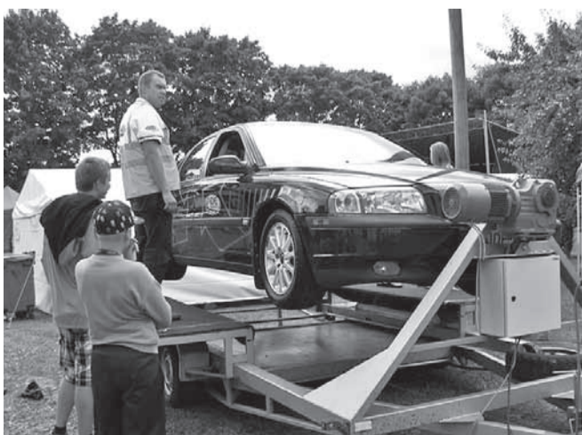
Ümberpööratav auto – kas pärast liiklusõnnetust paiskub auto üle katuse või jääb seisma muusse asendisse kui ratastele?