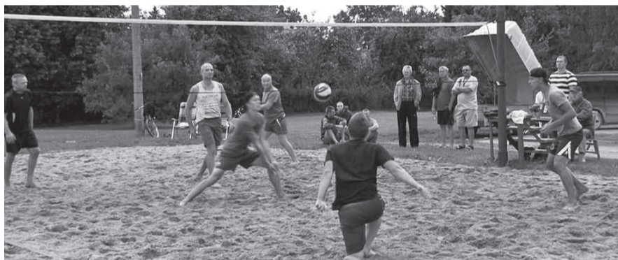
Võrkpall on võrratu!