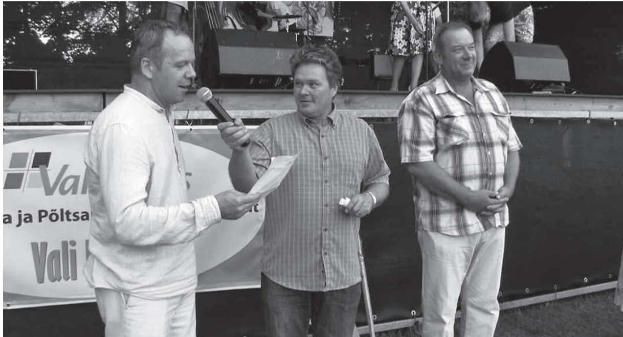
Meie linnaapea jutustab või deklameerib muigel ilmel midagi näiliselt lõbusat.