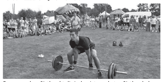
Rammumehe võistlusel tuli rinda pista raskete võistlusaladega ja kuuma ilmaga.