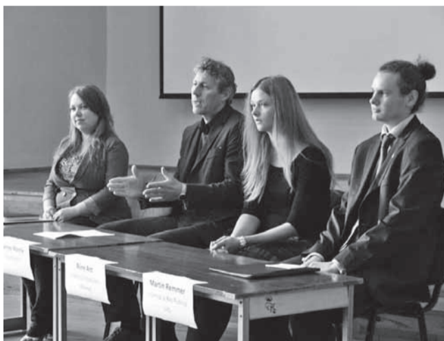
Võhma linna volikokku kandideerijad silmitsi õpilastega.