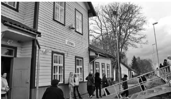
Kõik huvilised kogunesid raudteejaama, et tutvuda uue rongiga, mis tuleb liinile 1. jaanuaril 2014.