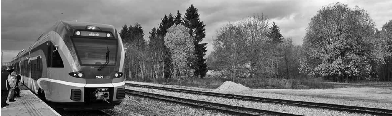
Teisipäeval, 15. oktoobril kell 15.09 saabus Võhma jaama uus diislrong.