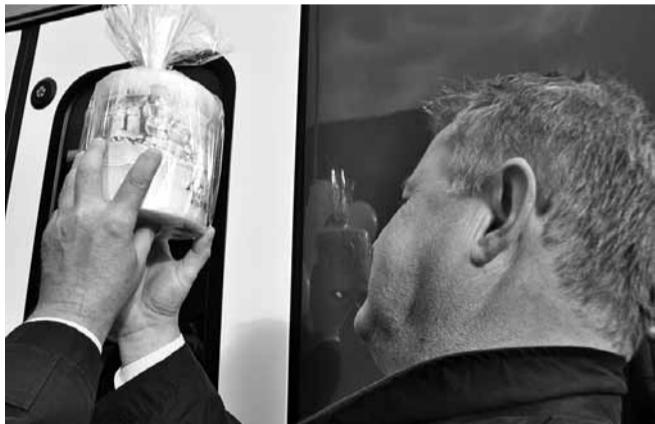
Linnapoolne kingitus reisirongre tarnivale ettevõttele.