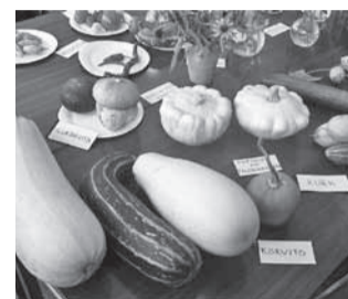
Enim olid esindatud kõrvitsalised.

Lillekimbud olid sügise saabumisele vaatamata kirevad. Õpilaste vaieldamatu lemmik oli lillede seas jaapani füüsal ehk hiina latern.