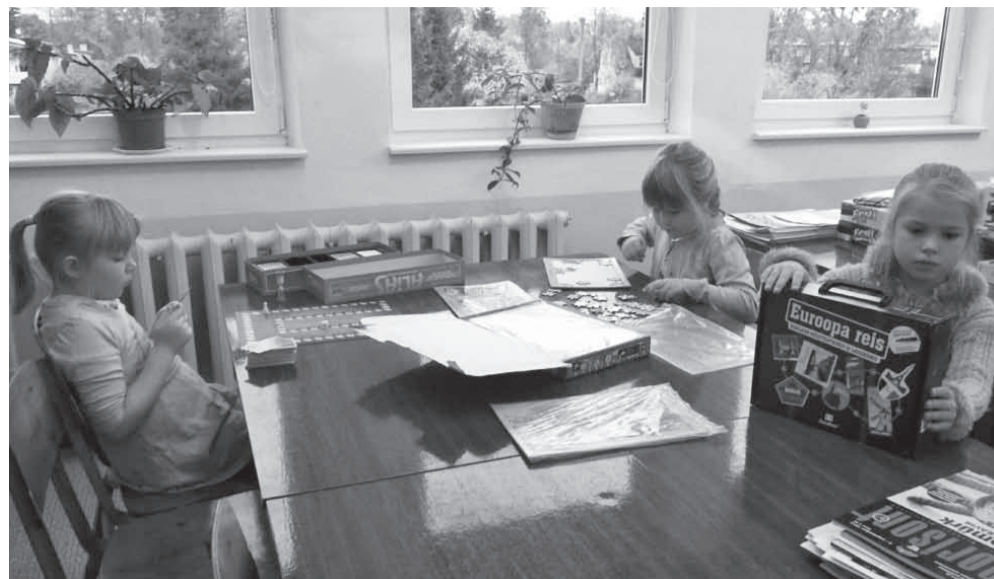
Esimene klass naudib vaba tundi raamatukogus.

Kuu aega pikast kooliteest on seljataga. Küsin tüdrukutelt, mis sellel ajal kõige toredam on olnud. Kõigepealt ikka meenuvad koolitunnid ja vestlused koorub välja, et lemmikud on kunst, tööõpetus, laulmine ja lugemine. Et lu-