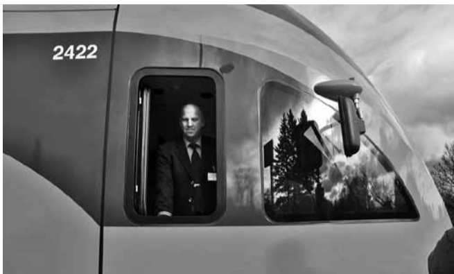
Vedurijuht on valmis uuteks reisideks.