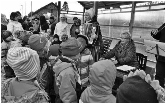
Vaprad lasteaialapsed laulsid pillimeeste muusika saatel.