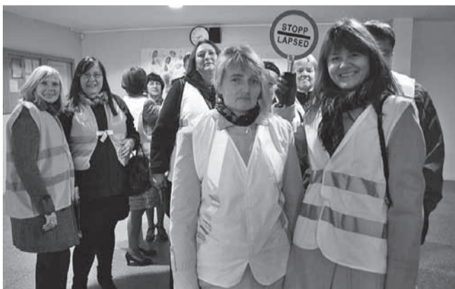
Õpetajad on valmis ekskursioonile minema.

Pärast kogunesid õpetajad ja tunde andnud õpilased ühe laua taha, kus koos muljetati päeva sündmuseid. 12. klassi poolt oli õpetajatele kingituseks isetehtud jäätis.