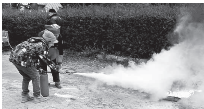
Meie õpilased tuld kustutamas.