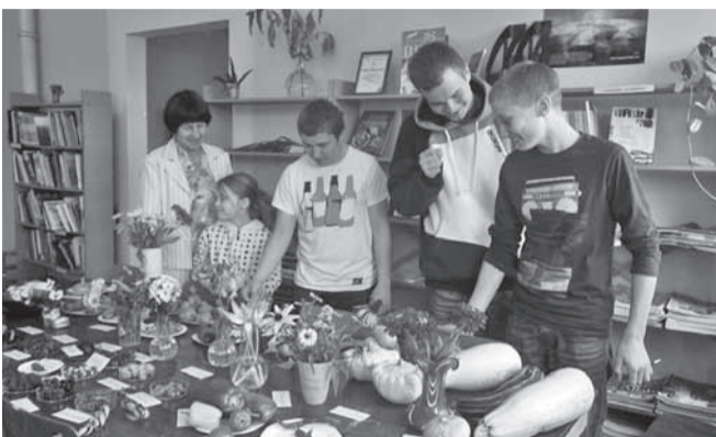
Näitusele jagus külastajaid igas suuruses.

Näitus sai teoks just õigel ajal, sest sel ajal, kui eksponaadid sooja tuba nauti-