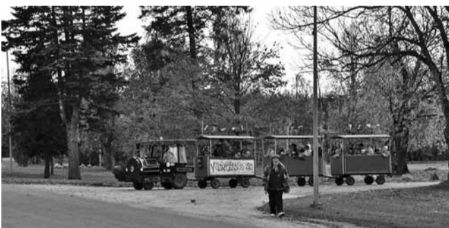
Lapsed saabusid kohaliku "Võhma Ekspress" rongiga.