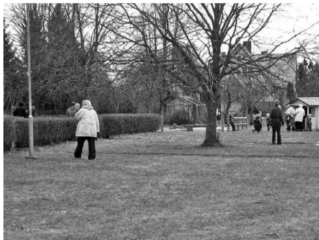
Maastikumäng „Otsime mune“