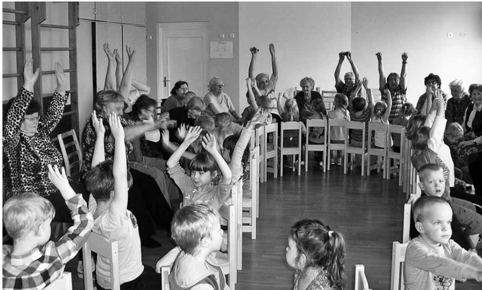
Toolidel võimlemine on huvitav!