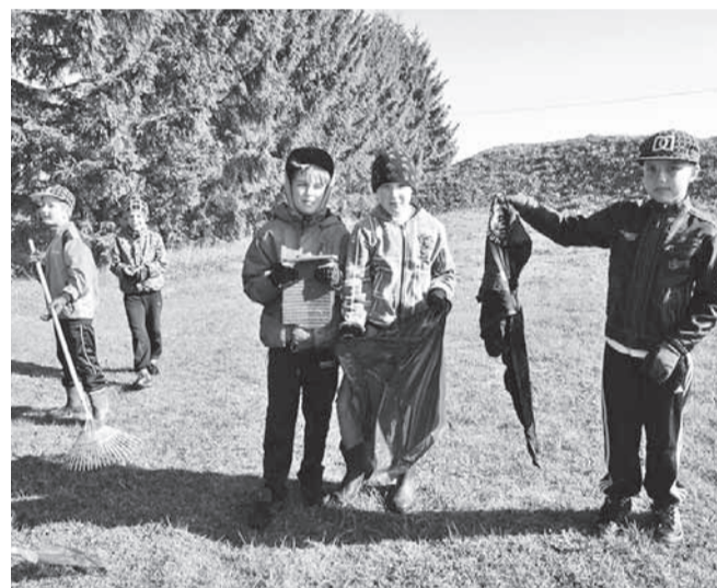
2. klassi leiud staadionilt: katkine kelk ja särk

Täna oli üpris lahe päev. Pidime minema poole kooli õpilastega maanteekraave koristama. Mitte et koristamises midagi lõbusat oleks.