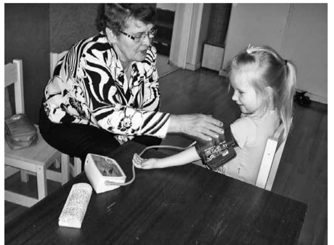
Pereõde mõõdab vererõhku.

taed, kool, kultuuri- ja päevakeskus ning linnavalitsus.