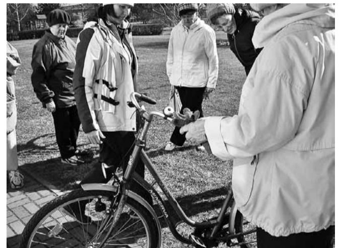
Üle vaadati ka suured päevakeskuse rattad.