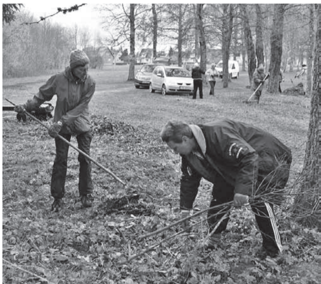
... langenud okste korjamine.