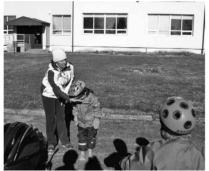
Kuidas kanda kiivrit.

Südamenädala viimasel üritusel olid esindatud nii las-