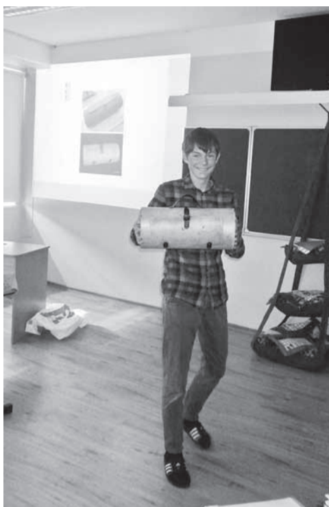
Rando on tööga rahul.

Pragu kehtivas põhikooli riiklikus õppekavas on kirjas, et põhikooli kolmandas kooliastmes teevad õpilased loovtöö. Võhma Gümnaasiumis tehakse loovtööd 8. klassis. Loovtööks võib olla õpilasuuring, projekt (üritus, näitus, võistlus), kunstiteos, muusikateos või muu taoli-