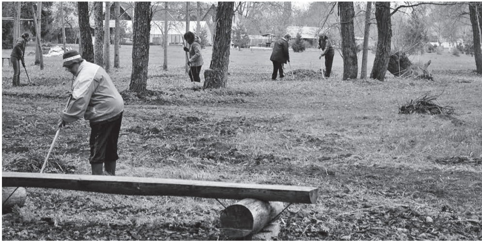
Talgulisi ootas riisumine ja ...