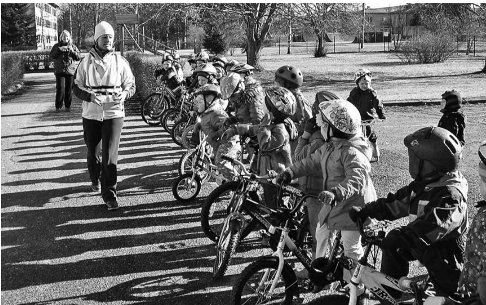
Kas rattad korras.

Neljapäeval, lihavõttepühade eel toimus koos päevakeskuse rahvaga lasteaia alal maastikumäng „Otsime mune“. Küllap pühadejänesed käisid ikka neid mune segamas, sest