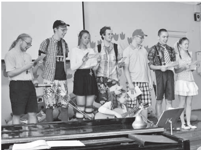
Lõpetajad panid õpetajad laulu sisse