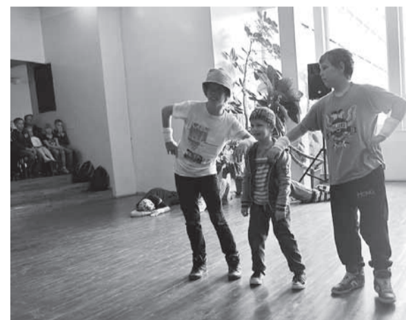
5. klassi tantsu hoidis üleval väike breikar.