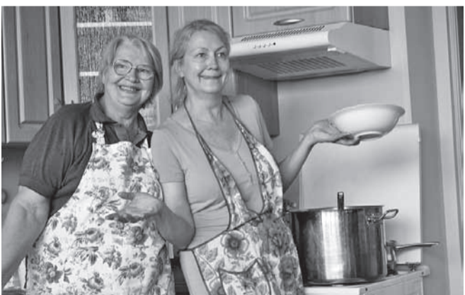
Kaks vaprat supikeetjat.