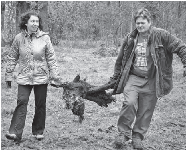
Tekkinud oksarisu viidi lõkkesse.