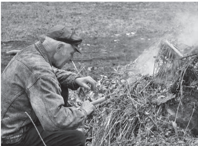
Lõkkemeistri sõnul kehtivad tuletegemisel kindlad reeglid.