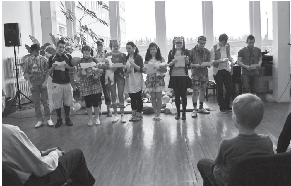
Professoritele laulu esitamas.

Jorgen: Minu ja mu klassikaaslaste koolitee gümnaasiumis on jõudnud magusa lõpuni. Kõige meelde jäävamad sündmused on olnud erinevad kooliüritused. Nüüd on aga hea meel, et lõpuks saab kooliaeg läbi.