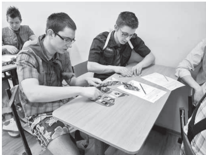
Viimasel koolipäeval sai lõpuks ometi jälle voltida ja kleepida.

23. aprillil lustisid abiturientid koolimaja seinte vahel viimast korda. Neil olid sel päeval mõned erilsed koolitunnid ja siis pidid nad aastate jooksul koolist omandatust aru andma 11. klassi õpilastest koosneva professorite komisjoni ees.