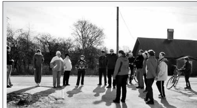
Ja nii algas südamenädala "Sinu sammud loevad" raames korraldatud rahvamatk. Pühapäeva, 21. aprilli hommikul kogunes matkagrupp linnavalitsuse juurde, et suunduda lennuvälja poole.