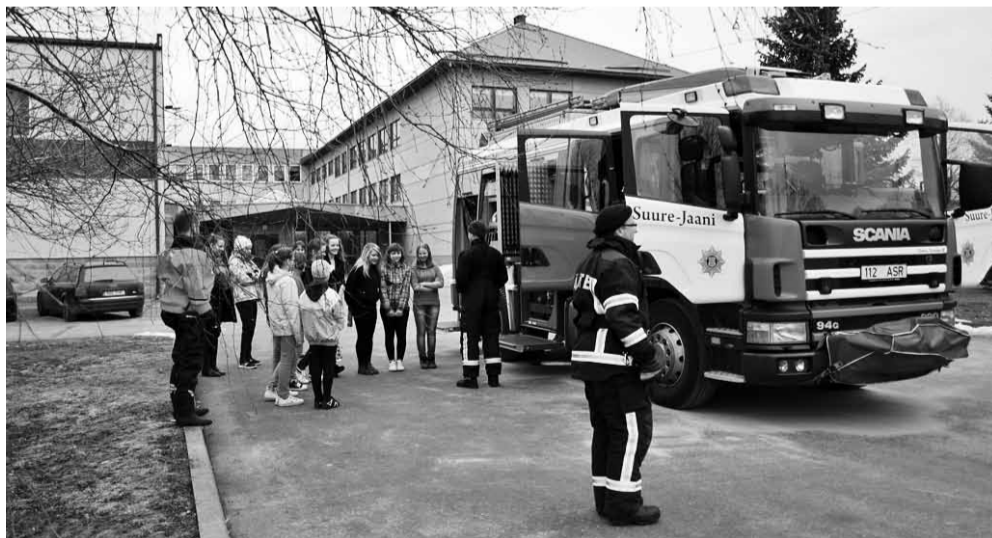
Tuletõrjeautot koolimaja parklas õnneks tihti ei näe.