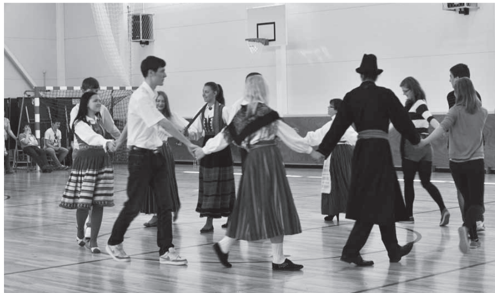
Võidukas 10.–11. klassi tantsurühm võlus nii kostüümide kui rõõmuga.

Klassid tõmbasid loosi ja esitamisele tulid tantsud lapaduust kosjatantsuni. Hinnati nii tantsukava,