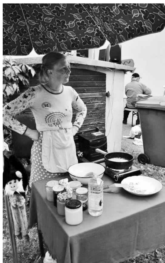
Kes soovib pannkookidega maiustada, astub ligi!