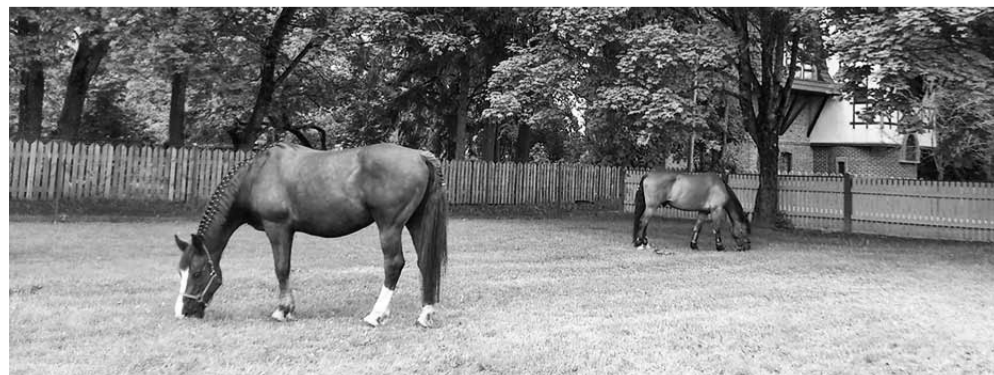
Hobune on ikka suur, soe ja ilus loom – eriti lakk ja saba ja silmad.