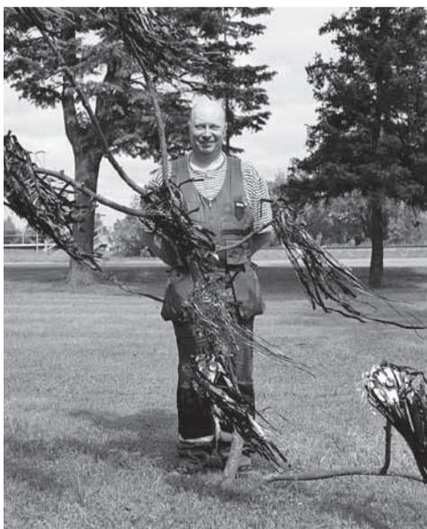
Publik valis oma lemmikuks Maasikavalvuri, mille autoriks Heiki Lehis.