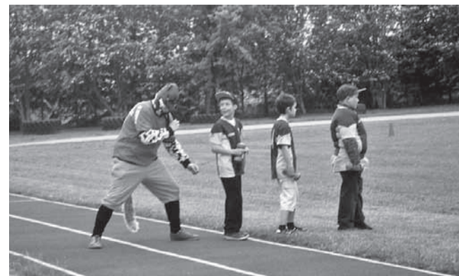
Olümpiamaskott Volli proovis lastega kõik kaasa teha.