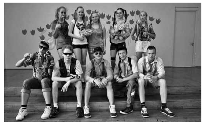
Mõmmikud, veepüssid ja traksipüksid on tutipäeva dress code.

9. klassile helises viimane koolikell 29. mail. Kümme üheksandikku olid need, kes sel päeval koolimajas kõige suuremat lärmi tegid ja vett pritsisid. Tutipäeva lõpuaktuse korraldasid 8. klassi õpilased, kes esitasid üheksandikele küsimusi kontrollimaks omandatud haridust, samuti pidid nad ära tundma oma klassikaaslaste lapsepõlvepiltide pealt ning kujutama pantomiimina meie õpetajaid.