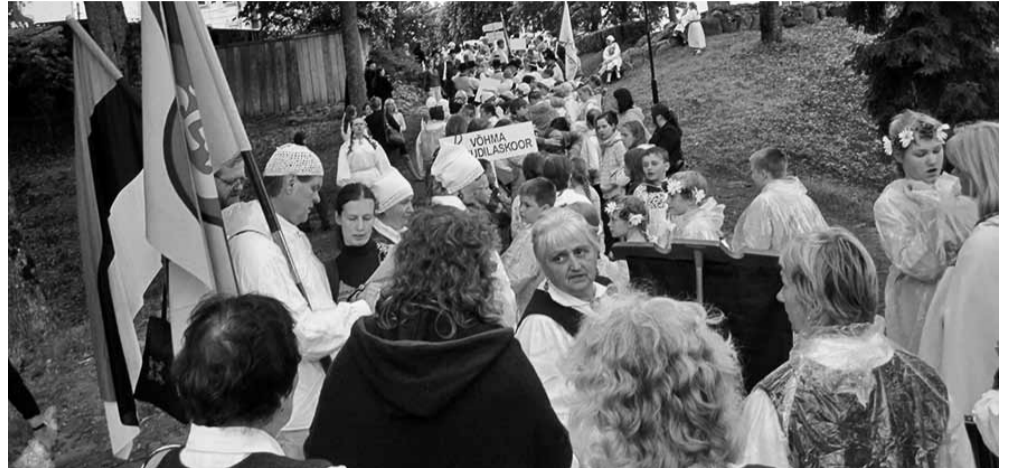
Vaatamata vihmäsabinale on lauljad-tantsijad säilitanud hea tuju ja ootusärevuse.

Meie linna esindasid järgmised kollektiivid: Võhma mudilaskoor (juhendaja Maila Juudas), Võhma lastekoor (Maila Juudas), laste tantsurühm Rukkilill (Cilly Sarv), naistantsurühm Lille-