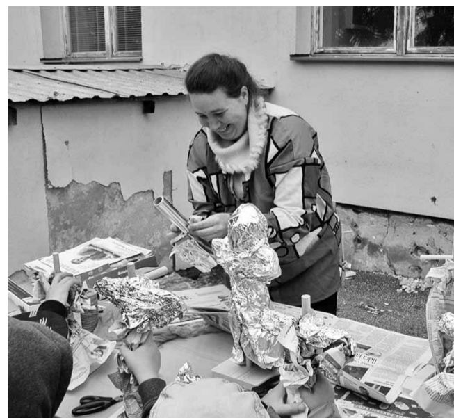
Cilly jagas näpunäiteid, kuidas valmistada hernehirmutist.