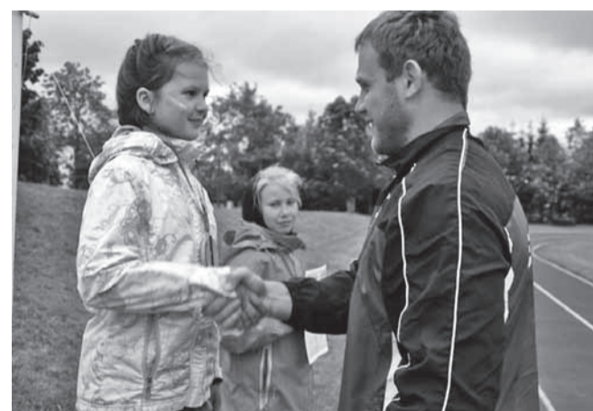
Maailmameistri käepigistus.

Kooliolümpial järgiti ausa mängu põhimõtteid. Hea meel oli näha, et õpilased olid rõõmsad ja võistlus-himulised, olenemata külmast ilmast. Kui võistlused said läbi, oli aeg teha kokkuvõtteid. Võitjaid autasustati medali, diplomi ja magusate eriauhindadega. Ees ootas aga veel üks üllatus. Autasustamisele saabus üllatuskülaline – olümpiavõitja ja maailmameister Heiki Nabi.