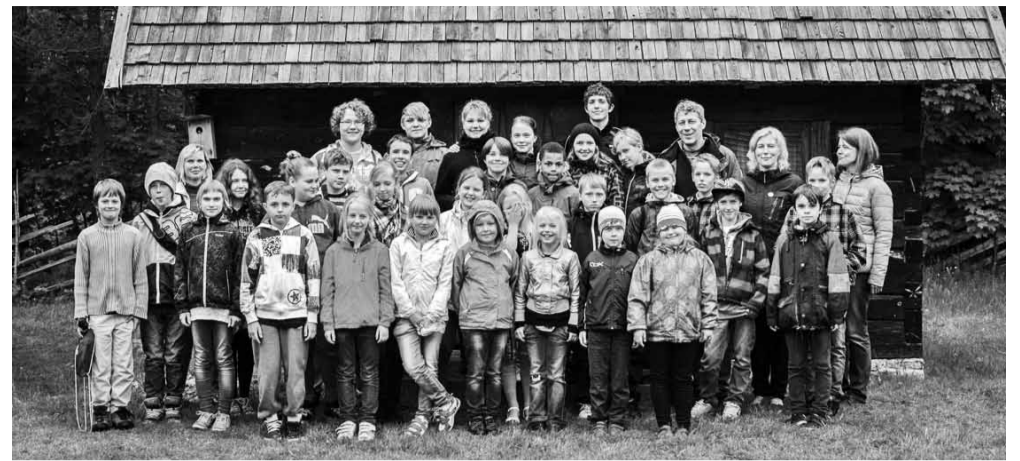
Saaremaad käisid uurimas tublid õppijad, sportlased ja muusikakooli õpilased

Edasi rändasime piki Saaremaa põhjarannikut Panga pangani. Oma 22 meetriga merepinnast on Panga pank Saaremaa kõrgeim. Seal olevat paganatest saarlased vanadel aegadel parema kalaõnne huvides ohvreid toonud.