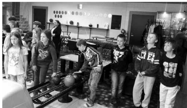
Kuuli veeretada oli äge!