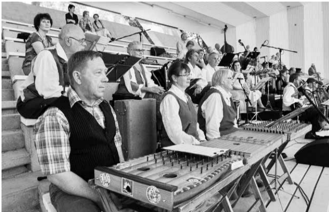
Ühiskapellis löid kaasa ka Piliistvere Pillimehed.

Viljandi maakonna laulu- ja tantsupidu „Ühtses