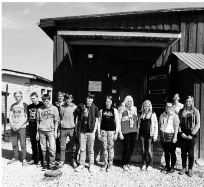
8.a klass Viljandi loomade varjupaiga juures.

Lõpuks jõudis kätte päev, millal minu ja Pirkiti koostöös valminud kassipesa ja tekid loomade varjupaigale üle anda. Meie klassil oli niikuinii vaja seoses karjääriõpetusega külastada puidutööstust Dold, nii võtsime ka varjupaika kaasa kogu 8.a klassi. Igaüks pidi viima sinna kingituseks kotitäie kassiliiva ning hommikul jäid inimesed tänaval vaatama hanereas kooli poole kõmpivaid õpilasi, näpus kassiliiva kotid.