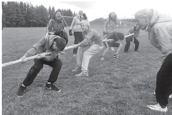
Kõievedu küttis kirgi.

28. mail sai teoks suur sportipidu – kooliolümpia. Seda suurt ettevõtmist toetas Eesti Olümpiaakadeemia. Ürituse organiseerimine algas juba varem. Koolis moodustasime oma Olümpiakomitee, mille koosseisu kuulus kümme õpetajat. Omavahel jagati ära ülesanded.