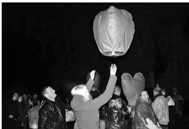
Ja nii saatsime oma salajasemad soovid ja unistused laternaga teele.