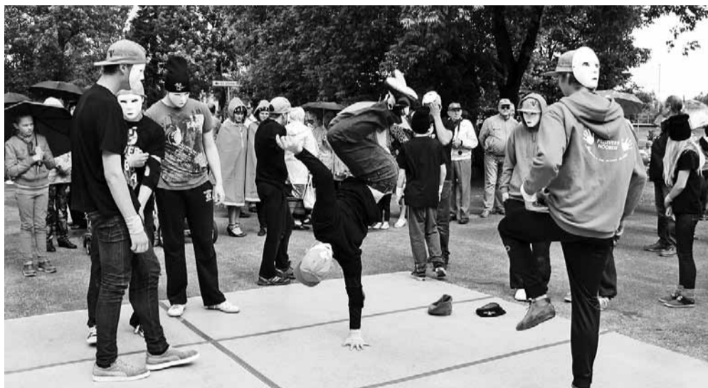
Complete Crew breikarid - inspiratsioonist ja muhedusest pakatavad noored.