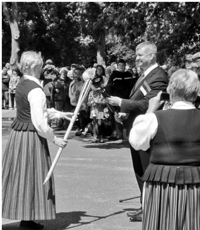
Viljandi maavanem annab üle ja meie linnapea võtab vastu Presidendi poolt süüdatud võidutule.