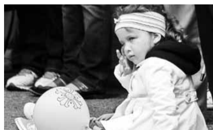
Kodu- ja isamaaarmastuse algus.