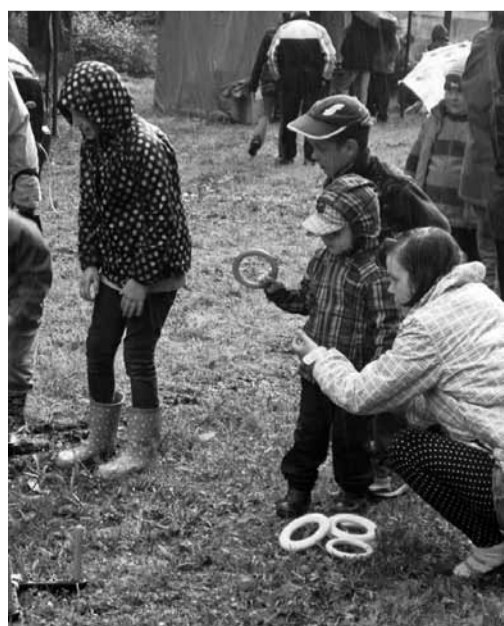
Lapsed võtsid õhinaga osa rõngaviske mängust.