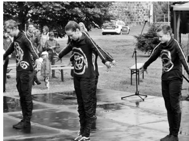
Tantsukool JJ-Street Viljandi esitab hip-hop tantsu "Vesi".