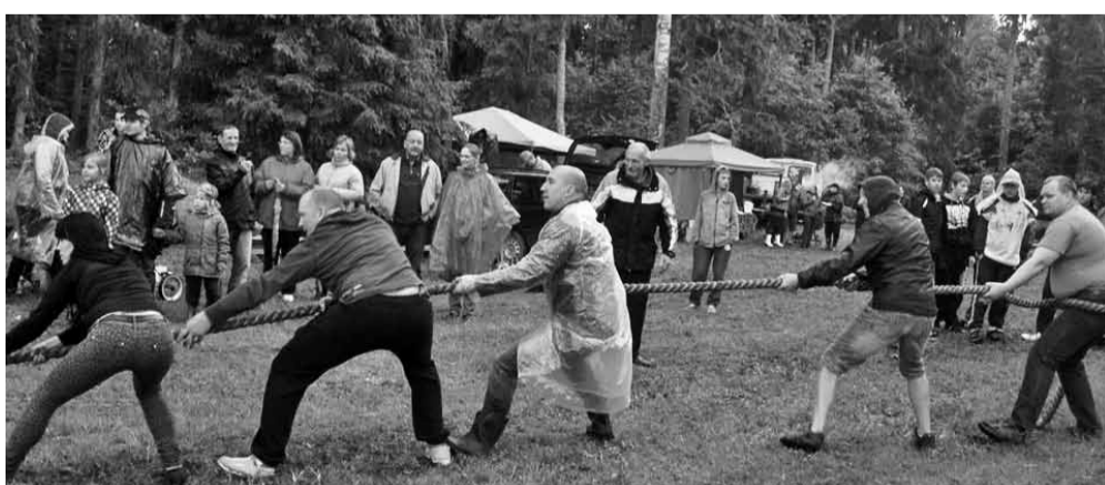
Kõievedu on rahvalik jõu- ja osavusmäng, aga ka sportlik võistlus.