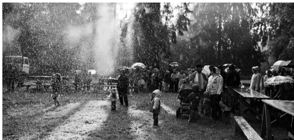
Niisuguses vihmasesajus algas meie jaanipidu!