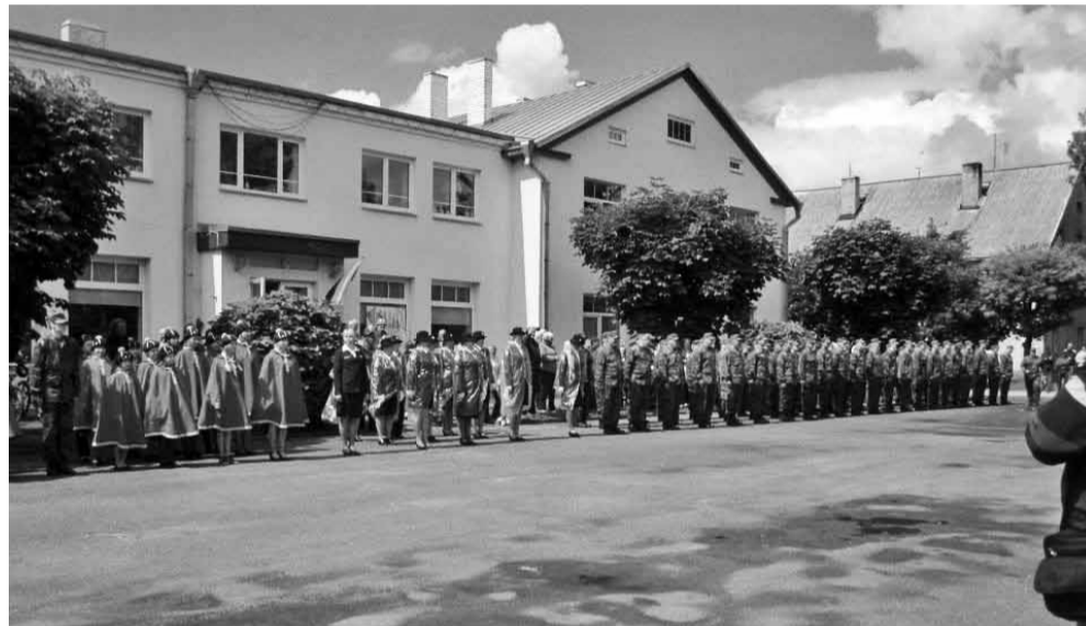
Võidupühal oli kaitsevælastest pidulik rivistus Vaba Aja Keskuse ees.