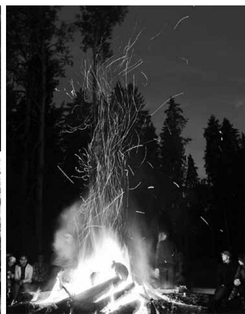
Jaanilõkke põles piduliste rõõmuks kaua-kaua.