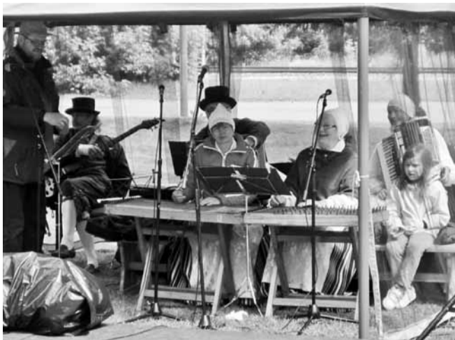
Kui Pilstvere Pillimehed on muusikat mängimas, on ka elamus garanteeritud.