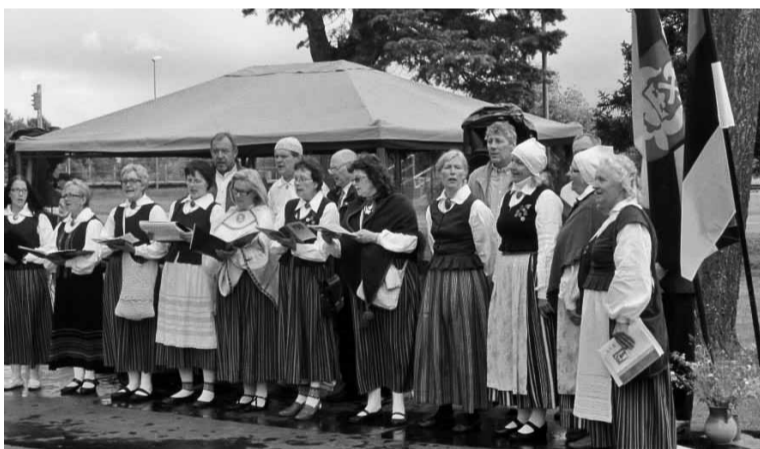
Laul teeb rinna rõõmsaks nii esinejatel kui ka kuulajatel.