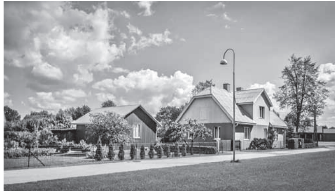
Heakorrakonkursi võitja kodude arvestuses ja asutuste arvestuses.