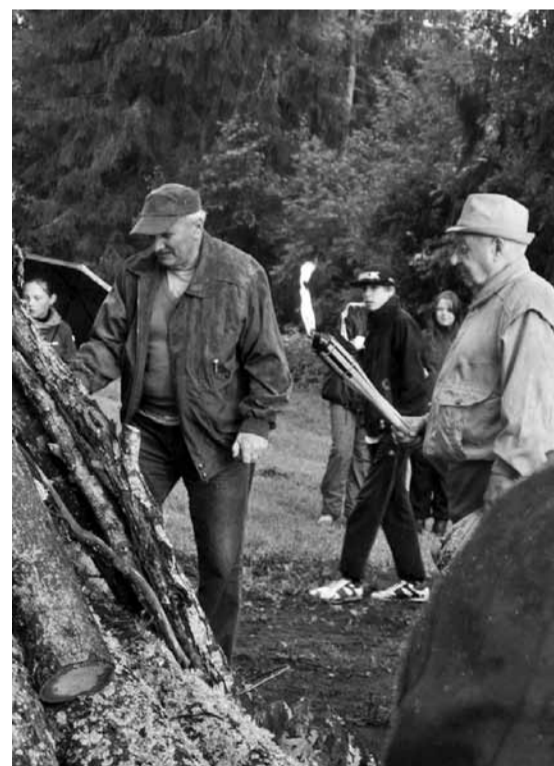
Jaanid süütavad lõkke.