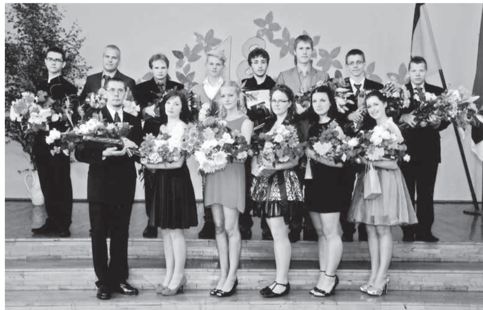
Võhma Gümnaasiumi 12. klass