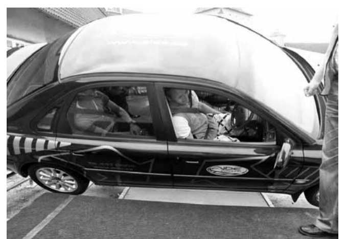
Ümberpööratav auto simuleerib liiklusõnnetust.