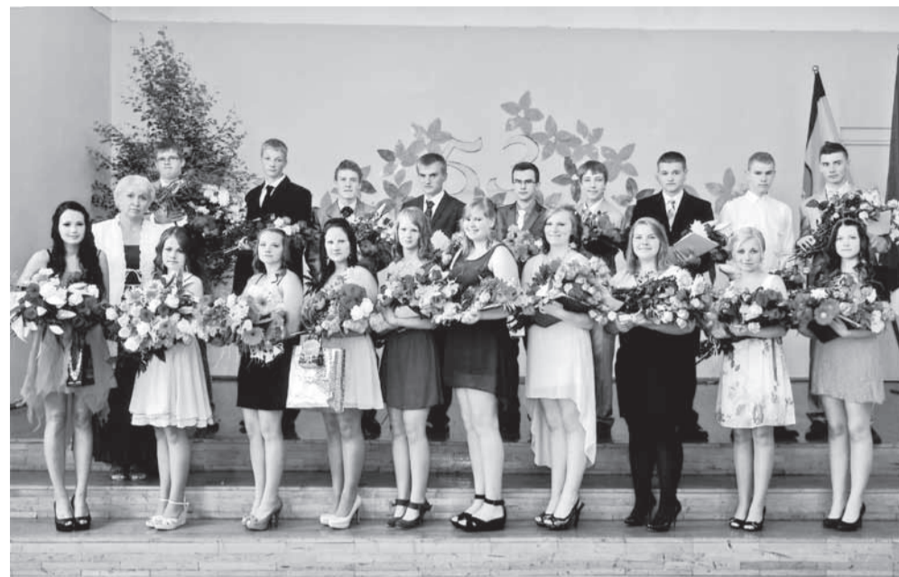
Võhma Gümnaasiumi 9. klass