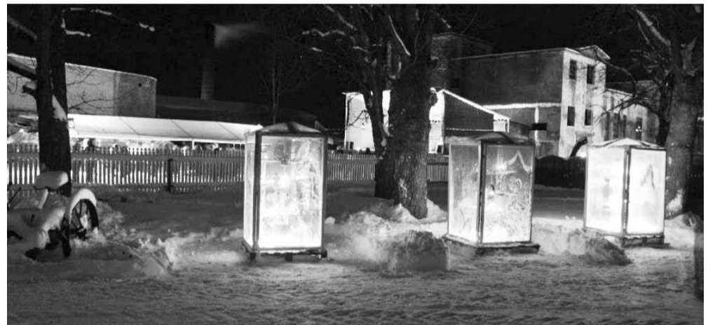
Küünlavalgusest kuldset helinat laternais ...