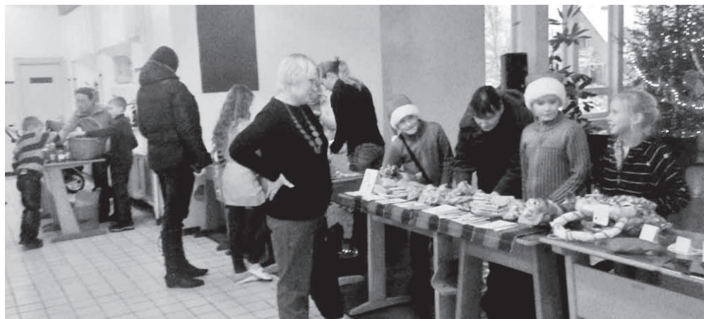
Laadakaupa uudistamas