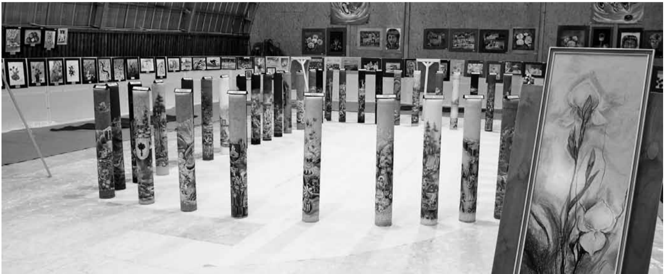
Küünla- ja kunstinäitus.

Sel korral niimoodi. Teisel korral ehk teisiti. Mõnikord on vestlustes esile kerkinud ka küsimus, milleks sellist üritust teha, kas see on kasulik? Korraldajad leiavad, et kui te ainult kasutoovaid asju, siis ei jäägi väga paljut järele, mida tasub teha. Küünlavalgus-