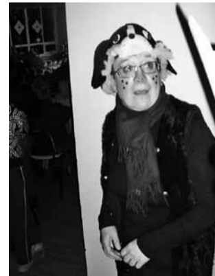
Pontu ärkas üles ...

hunti ja rebast märganud ning püüdsid Pontut äratada. Viimasel minutil jõudsid hunt ja rebane uksest välja silgata ja juba tegi Pontu silmad lahti. Mis imelik hais siin on? Kus ma olen? Miks on kõõgis tunda Hundi-Ülle ja Rebane-Maire lõhna? mõtles Pontu virgudes. Ja kus on piparkook?