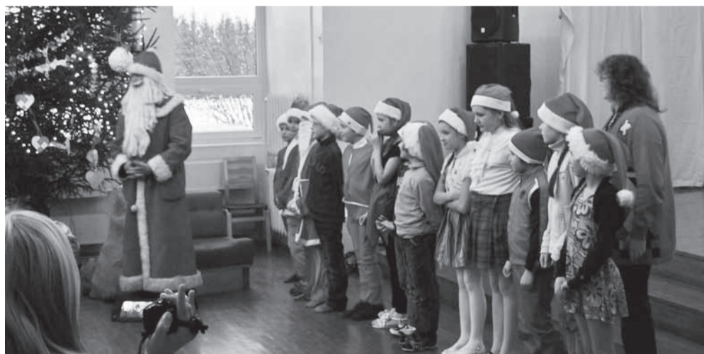
3. klass jõuluvanalt kinke lunastamas

loovtööna. Jõulupeo sissejuhatuseks esines draamaring. Pärast seda saadeti õpilased töötubadesse. Töötubades sai teha mitmeid erinevaid tegevusi: telefoniripatsite valmistamine, paberist baleriinide lõikamine, paela punumine, puust kuuseehete ja riidest päkapikkude valmistamine ja liivakaartide meisterdamine.