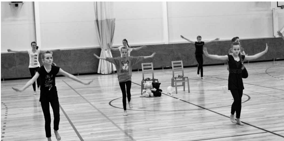
Võidukas 5. klass