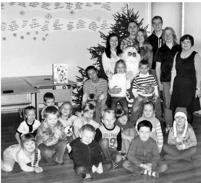
Rukkililled kooli päkadel külas.

„Sina, Pontu, jääd kodu valvama ning vaata, et keegi