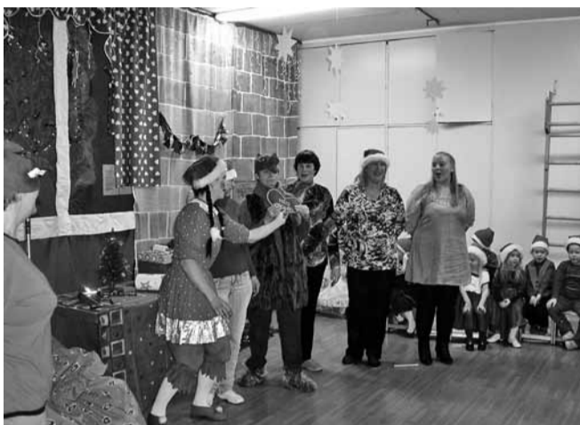
Muinasjututegelased jõuluvana juures.