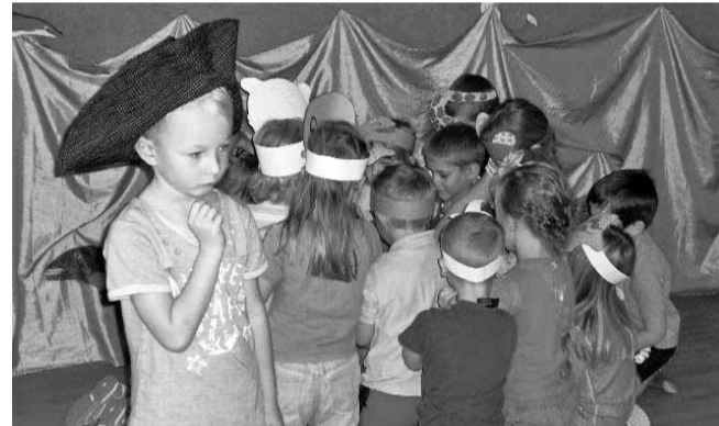
Rukkililled valmistuvad etteasteks isadepäeva kontserdil.