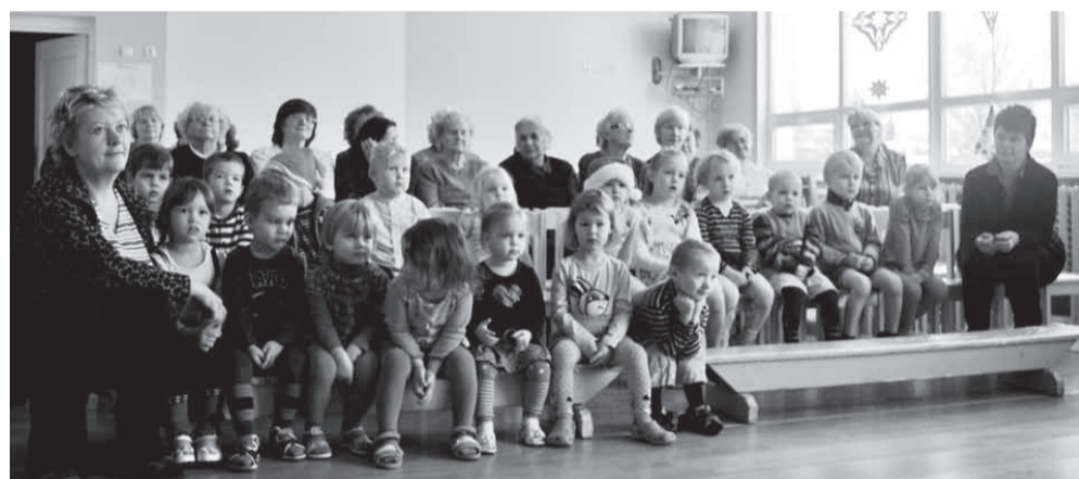
Publikuks päevakodus olid suured ja väikesed kuulajad.