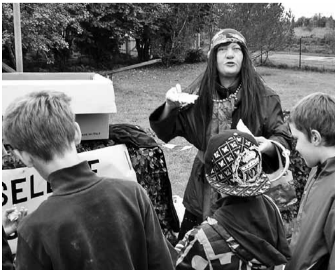
Miiklilaadal võis näha mustlasi.

seada kõige suuremat piparkooki nahka ei paneks. Naabri-Valve just helistas, et hunt ja rebane on küla peal luusimas!“ ütles päkapikk mantlit selga pannes ja läks uksest välja, et jõuluvanale vastu minna.