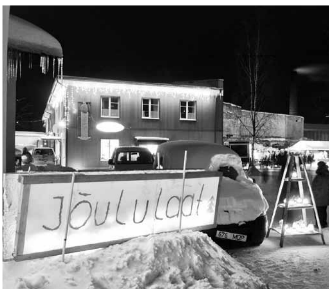
Jõululaad on kahtlemata linna suurim jõuluüritus.