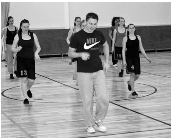
Ühistreening kogub tuure