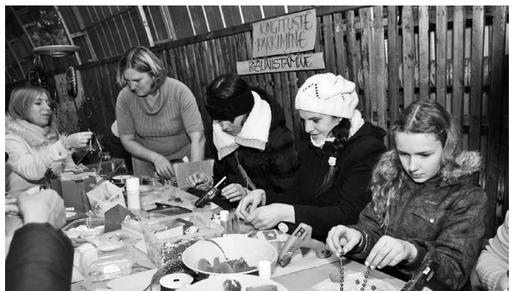
Kingituste pakkimise töötoas käis vilgas tegevus.