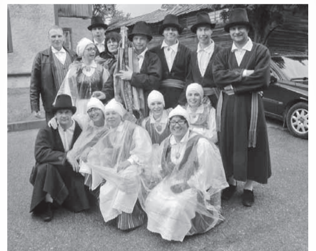
Pilgar Viljandimaa laulu- ja tantsupeol 2012. aastal. Pildil lisaks paar külakoori lauljat.

Saame kokku kolmapäeviti kell 19.00 Koo vallamaja saalis.