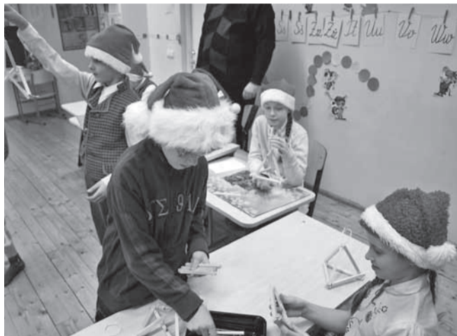
3. klassi päkapikud valmistavad puust jõuluehteid

D etsembris toimus meie koolis palju erinevaid tegevusi. Alustati jõulukuud sellega, et 3. detsembril kogunesime esimese adventi puhul kooli aulasse. Iga klass soovis seal oma jõulusoovid ja riputas enda tehtud jõuluehte kuusele. Huvijuht Tiina Tart luges raamatust ühe jõululoo.