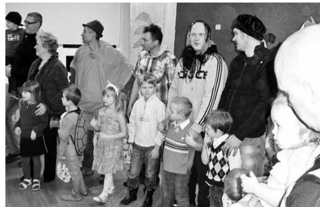
Isad uute riietega mänguringis.