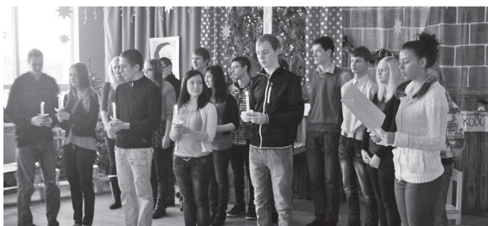
Gümnaasiumiõpilased esinemas päevakodus.

1.–6. klassi jõulupeo korraldasid 8. klassi õpilased Airo Ibrus ja Kullar Jõras oma