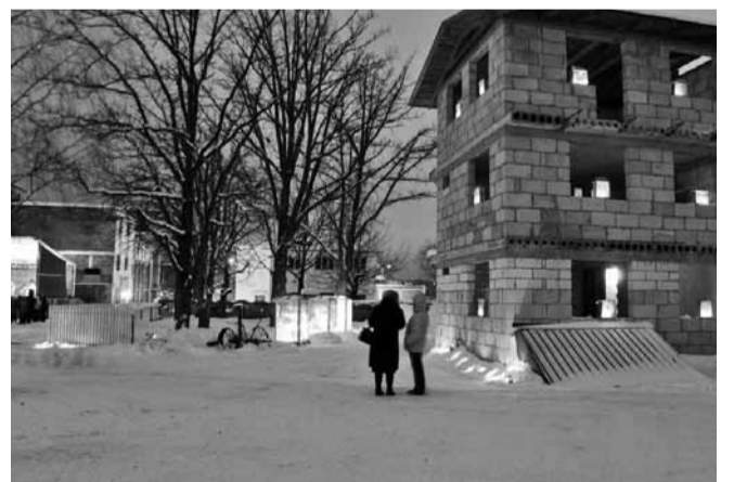
... ja aknais vilgub.