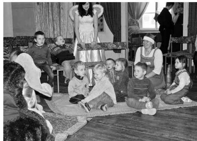
Terakesed Pilstvere jõulumaal.

„Vaatame, ehk on midagi unustatud siia meile vaestele nälja kustutamiseks, teeme hästi ruttu!“ kiirustas rebane hunti. Ehkki hundi silmanägemine oli väga vilets, töötas tema nina hästi ja leidiski lõhna järele üles hiigelsuure piparkoogi. Näuhti, rabas ta piparkoogi. Nüüd oli vaja veel uksest välja saada. Mingid päkapikud, kes kapi taga kinke pakkisid, olid ikkagi