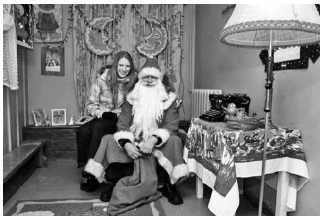
Jõululaadale lisas lusti fantastiline jõuluvana töötuba.