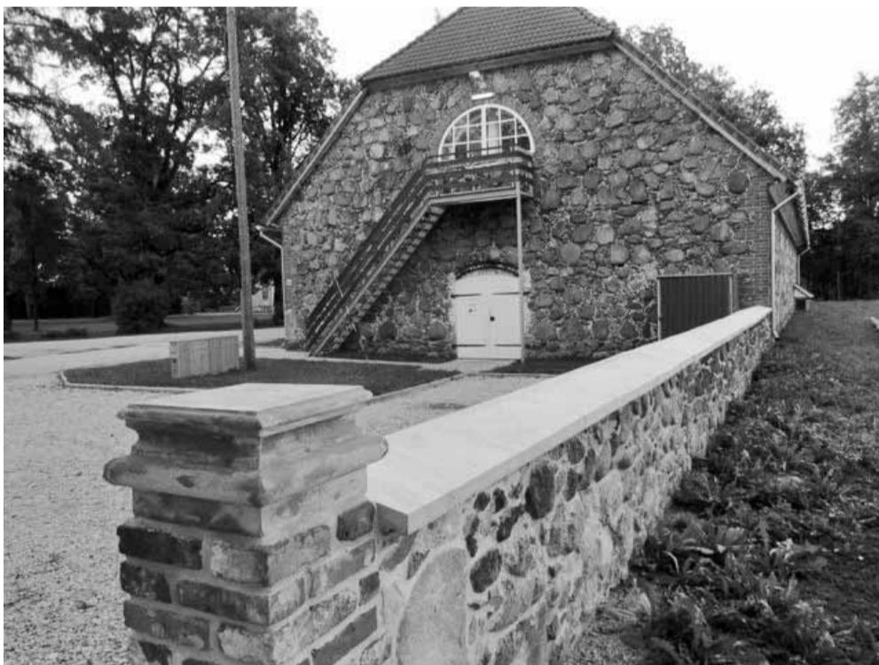
Lahmuse mõisaaiade keldrikorral on avatud taastuskeskus. Kõigil soovijail on võimalus saada lõõgastavaid ja tervislikke protseduure.

Külmakapsel e krüosaun – võib kasutada reumaatiliste protsesside, stressi, kroonilise väsimuse, depressiivse seisundi, luumehaaniliste haiguste puhul.