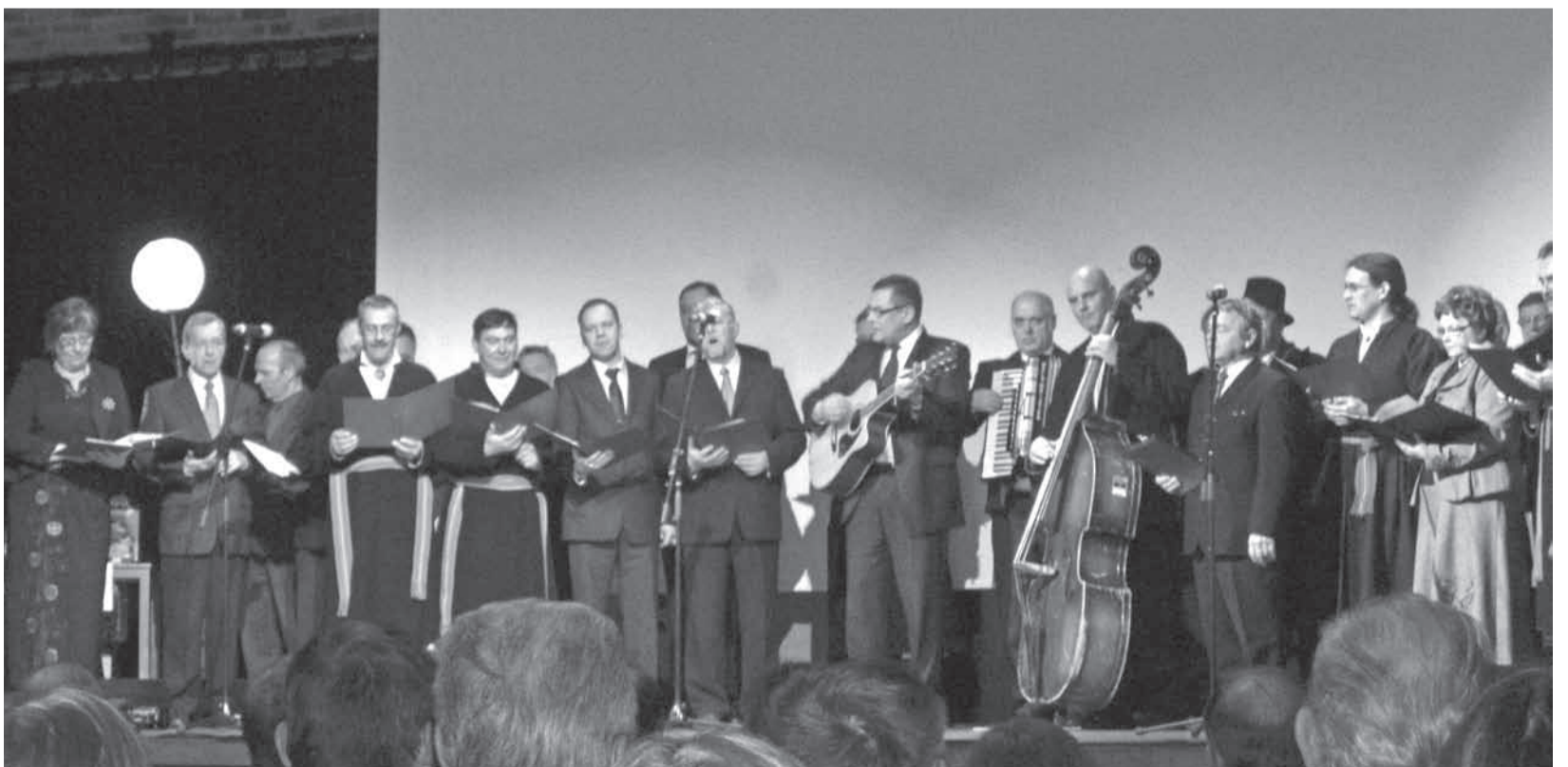
Nii need meite maakonna „linnaisad“ püüne peal kultuuri pakkusid.

Kahjuks ei tea paljud lehelugejad omavalitsuste liidu tegevusest eriti palju, seetõttu anname võimaluse lugeda sellest järgmisel leheküljel.