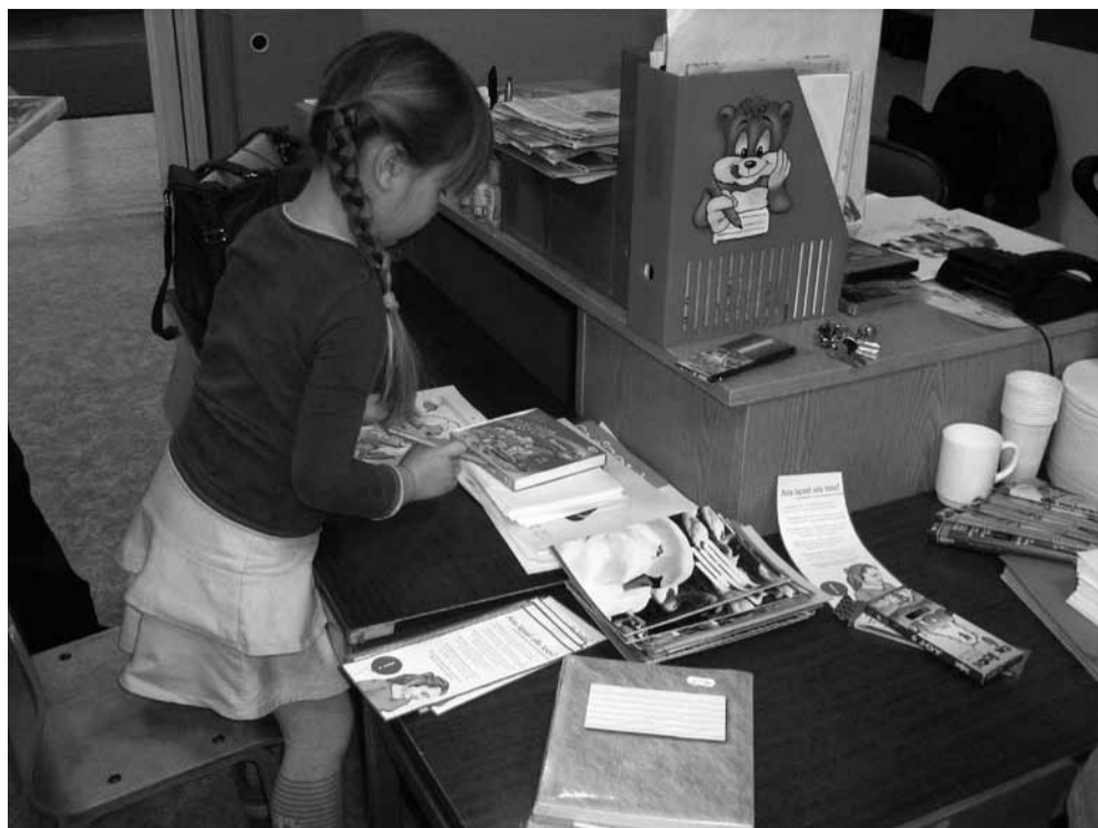
Kampaania käigus kogutu muutis lapsed uudishimulikuks