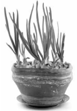
Sibulat saab juba praegu potis kasvatada.

Sibul on üks vane- maid kultuurtaimi, kelle metsikuid esivane- maid tarvitas inimene juba kiviajal. Kultuur- taimena hakati teda viljelema kõigepealt Kesk- ja Edela-Aasias umbes 5000–6000 aastat tagasi. Esialgselt viljelusaladelt levis sibul kõigepealt Egiptusesse ning sealt Vana-Kreeka