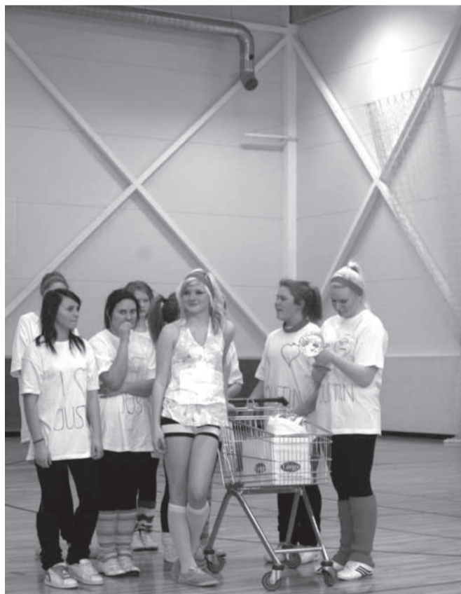
Võidukas Justin Bieberi fan club