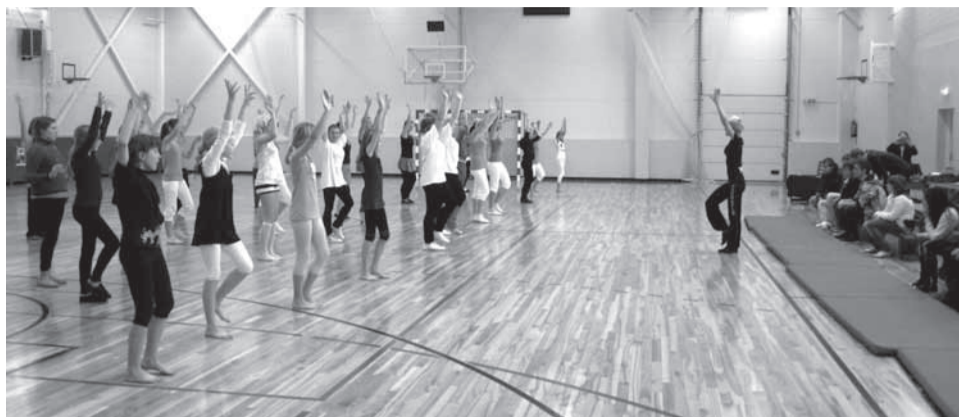
Hoogne ühistreening

nevad sissejuhatavad tegevused. Alustuseks mängiti soojendusmängu, siis jätkati „aeroobikavõitlusega“, kus võistkonnad pidid vastastest üle olema efektsamate aeroobikaliigutuste tundmises ning lõpuks pandi oma tervisealased teadmised proovile kiirviktoriiniga.