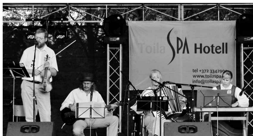
Mängi, pillimees, mängi sa! Kutsu õuele hõiskama!