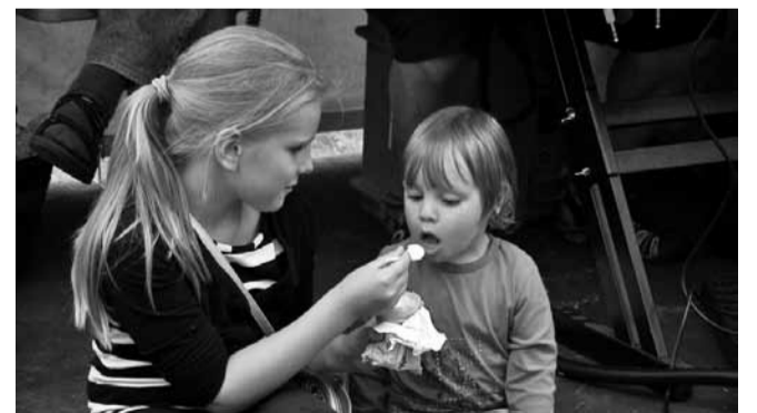
Koorejätis – mega hea!