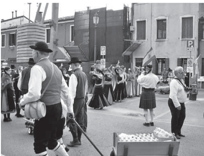
Rahvaste paabel, täis noori ja ilusaid.

Neljandal päeval pärast 3000 km teekonda jõuame Itaalia põhjaosas asuvasse Padova linna. Esinemislava on üles seatud Prato della Valle väljakul Basilica katedraali kõrval. Meie majutus on Padova lähedal provintsis 10 km eemal mägede jalamil asuvas Abano Terme vallas, mis on tuntud tervisekuurordina. Nii möödub neli tihedalt sisustatud päeva vahelduvalt edasi-tagasi festivalilinnas Padovas ja ööbimis- ning toitlustamiskoha Abano vahet sõites proovide ja kontsertide andmise ja kuulamisega. Peale festivali põhikontsertidel etteastumistega on meil veel igal päeval võimalus anda ka iseseisvaid kontserte erinevatel linnaväljakutel koos meiega bussis reisivate eel- ja tagajärgeliste rahvatantsijatega. Väga meeldejäävaks kujunesid tervituskontsert,