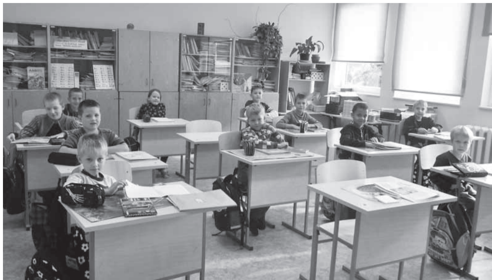
Teine õhkkond 1. klassis.