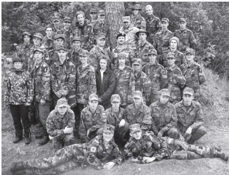
Ühispilt Läti laagris

25.06.–30.06. olid Võhma ja Kalmetu noorkotkad ja kodutütred Lätis Kuramaal Spare mõisas ühislaagris Läti noortega (Jaunsardze).