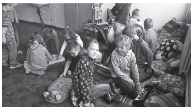
Vahetund mänguklassis

Kui uurin, kumb siis populaarsem on, õuemängud või arvuti, on jõud enamvähem tasakaalus. Televisoor ei ole