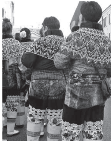
Kas hülgenahast püksid kaitsevad palavuse eest?