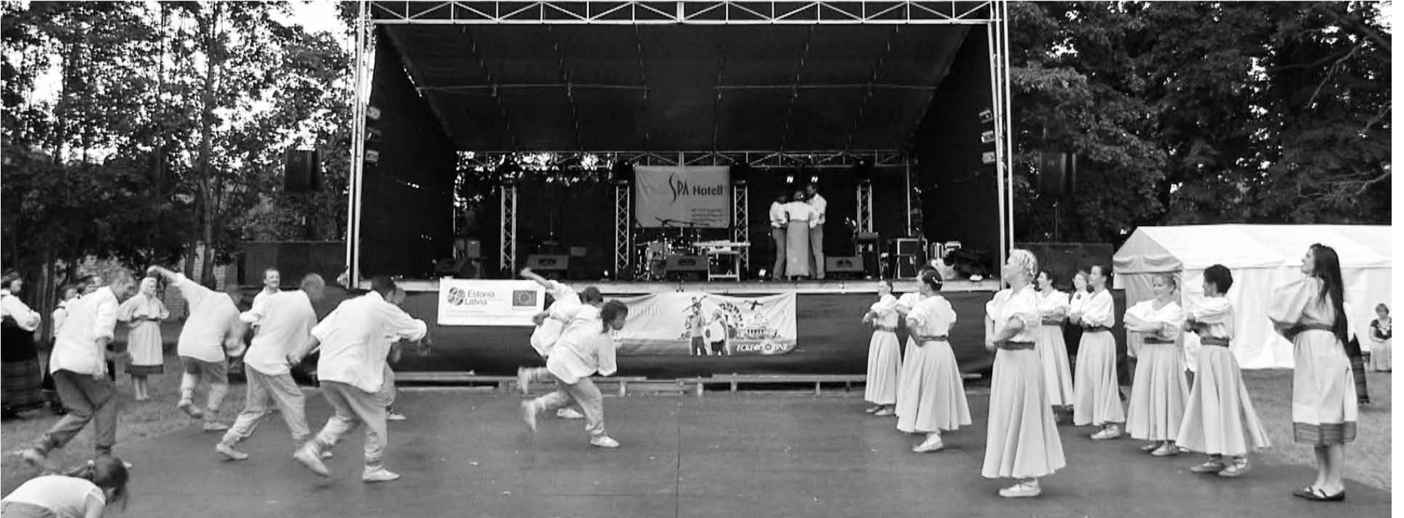
Tantsi-tantsi-keeruta, ole viisakas ja kummarda!