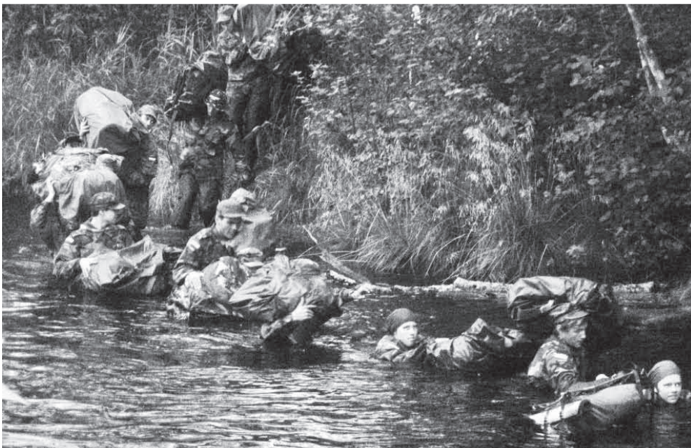
Jõge ületada oli päris ränk

kulus filtreerimisüsteemi ja varjualuste ehitamise peale. Pärast lõunat õppisime lõkettüüpe ja lihvisime tuletegemisioskust. Teine öö oli külmem kui esimene. Sel ööl toimus vaenlase kallalolemine meie laagris. Kuid sitkeid eestlasi ei suutnud lätlaste alistada. Hommikul oli äratus ning algas parvehitusprotsess. Parvega tuli oma varustus kuivalt üle jõe saada. Ja siis valmistasime söögiks kana. Pärast kanasöömist toimus matk soisel pinnasel ja tuli suunduda läbi jõe. Muidugi said me riided märjaks, ent koti sisu