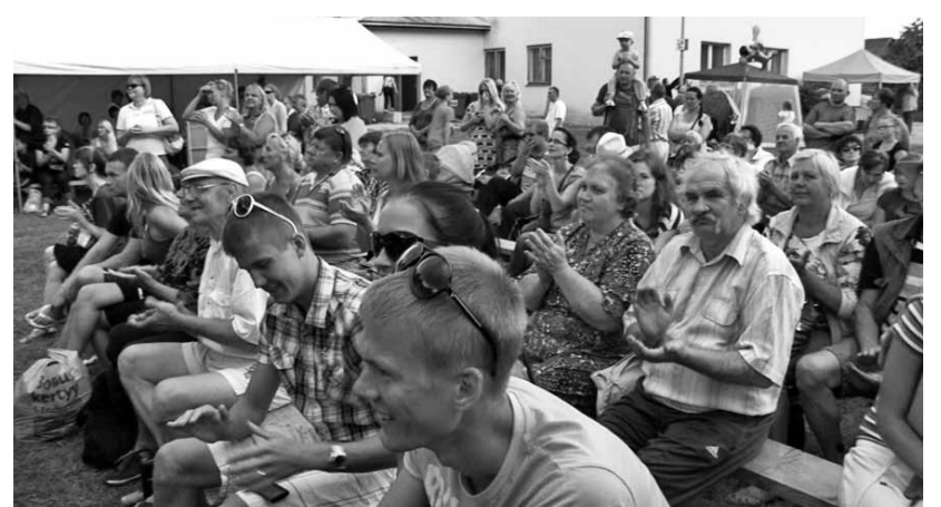
Laval toimuv läks korda kõigile - publik elas täiel rinnal kaasa.