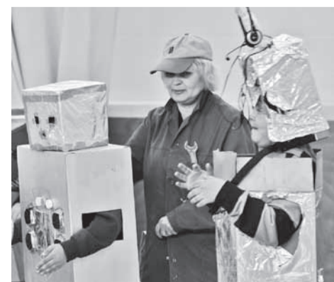
Tantsurobotid vajasid putitamist.