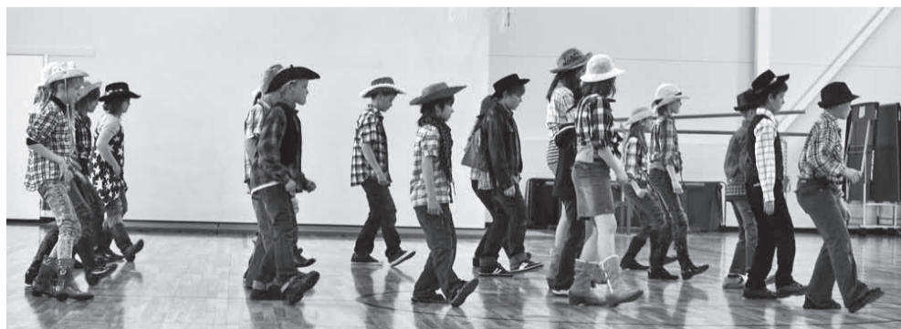
4. klassi line-tants oli üksmeelsuse musternäidis.