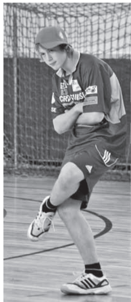
Julge hundi rind on rasvane!