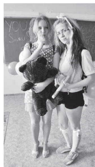
Õhupallid, roosa värv ja lutsukommid on tutipäeva lahutamatu kaaslast.