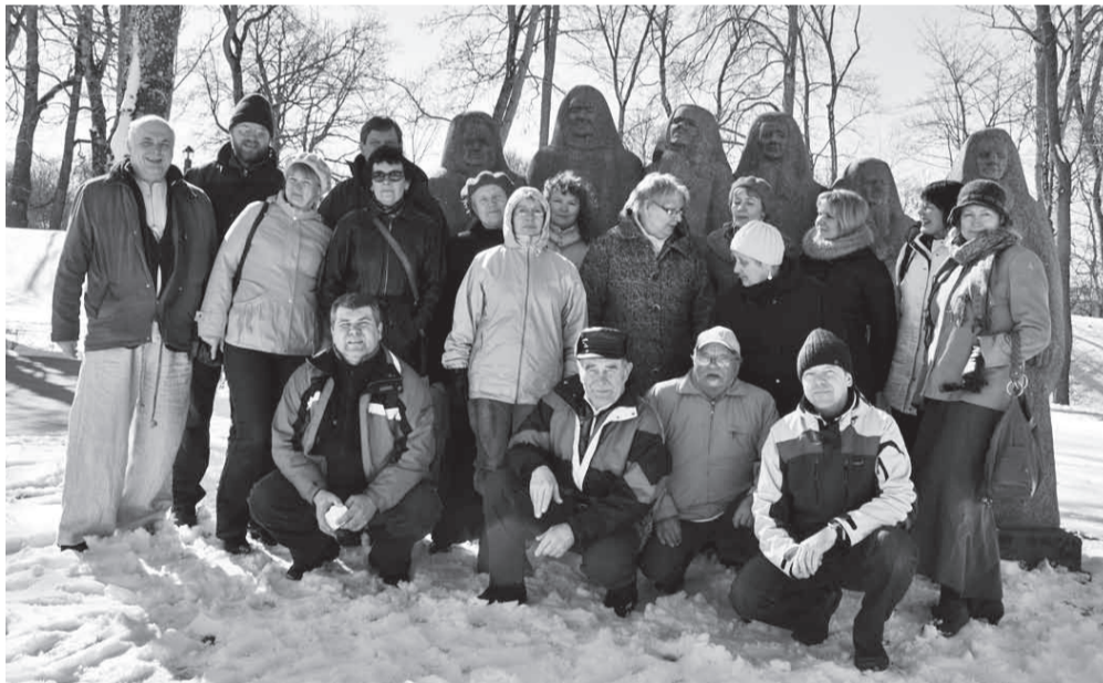
Võhmakad ja „kivist lätlased“ puhkehetkel Kuldigas.