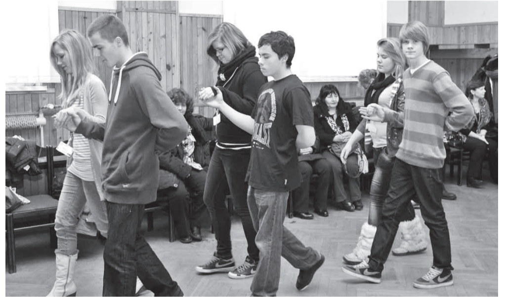
Poloneesi tantsusammud tegid tõsiseks.