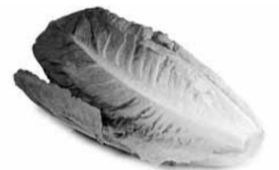
Rooma salat.

Salat on väärtuslik dieetkõõgiviili, mille väärtus seisneb eelkõige söögiisu tõstvas ja seedimist soodustavas toimes. Dieettoiduna soovatakse teda ka kehveresuse, hüpertooniatoive, diabeedi jt haiguste puhul. Salatimahl soodustab ainevahetust, vereringet ja närvisüsteemi talitlust, mõ-