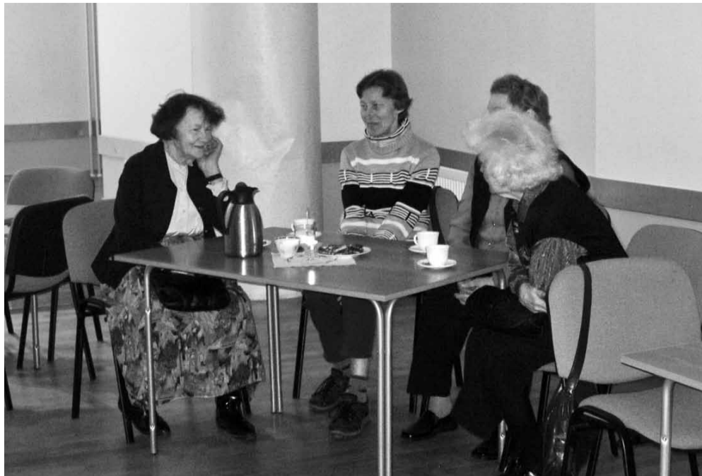
Tõeliselt hea luuleelamus said kõik kohaletulnud.