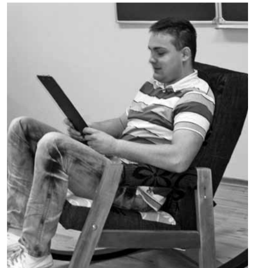
Tool kiidab tegijat.