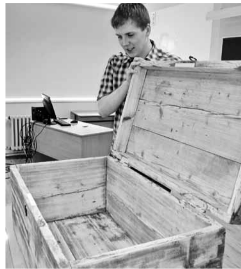
Täitsa hästi õnnestus.