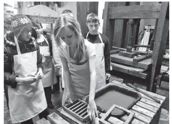
Paberivabrikus sai ise paberit teha.

Alguses hirmutas mind natuke mõte, et pean mine-ma kusagile võõrasse riiki, täiesti võõrasse peresse ning veetma seal peaaegu nädala,