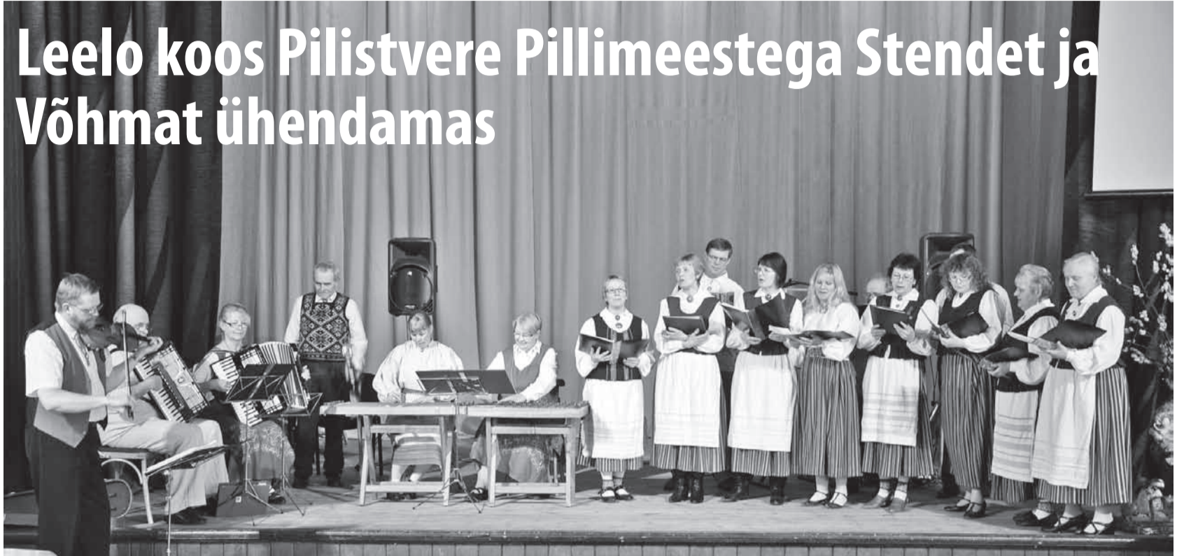
Kõlaga laulud ja mängigu pill!