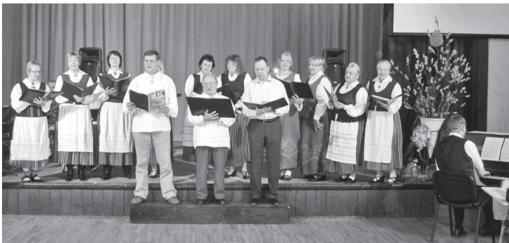
Mehed esireas, neid toetamas sopranid ja aldid tagareast.

lõbustusasutused on pühadel üldjuhul suletud. Majad ja tänavad on väga rikkalikult ja mitmekesiselt kaunistatud, mille tegemisel on kasutatud palju looduslikku materjali: põhilised on kase- ja pajuoksad, millel ripuvad värvilised munad. Talude juures kasvavatele tamme- puudele riputatakse värvilisi õhupalle. Lihavõtte laadal,