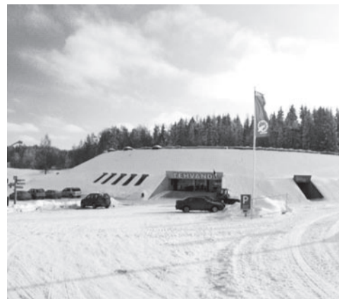
Tehvandi spordikeskus.

T ehvandi Spordikeskust peetakse Eesti talvekeskuseks number üks. See asub Otepää külje all Valgamaal. Tehvandil on oma külalistemaja, mis mahutab korraga kuni 69 inimest ning selle läheduses asub puhkemaja kuni 10 inimest. Talvisel ajal on spordisõpradele pakkuda valgustatud kunstlumerajad, jõusaal, kelmägi ning mootorkelgurada.