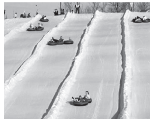
Snowtubing. (foto Internetist)

Spordivaru- tust on võimalik laenutada Tehvandi peahoone lähedal asuvast Fan-Spordi spordivaru- tuse laenutusest. Lisaks harrastajatele mõeldud sportimisvõimalustele on Tehvandil täiskompleks spordirajatisi professionaalidele: K90 suusahüppemägi, Apteekrimäe suusahüppemägede kompleks, staadionikompleks koos uue lasketiiru ja pealtvaatajate tribüüniga. Tehvandilt saavad alguse ka mitmed populaarsed rahvaspordi- üritused – Tartu Maraton, Tartu Rattamaraton, Tartu Jooksumaraton, Otepää rattasõit ja palju muud.