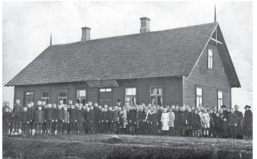
Piiri maja Tallinna tänava ääres andis peavarju Võhma koolile 1913–1919.