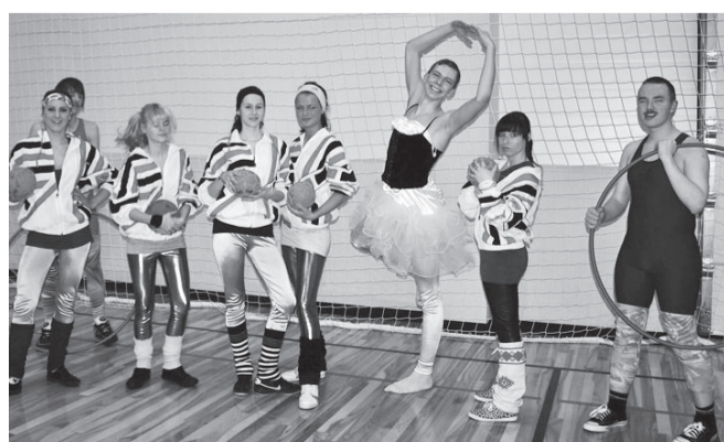
Võidukas aeroobikameeskond.

Traditsiooniline kooli aeroobikafestival „Näita vormi“ toimus tänavu 20. jaanuaril. Aeroobikat tegid ja vormi näitasid 5.-12. klass. Üldvõitjaks osutus 12. klass. Peale värvikaid ja tempokaid etteasteid oli jaksu veel ühistreeninguks koos žürii liikme ja aeroobikakuninganna 2010 Sandra Rajuga.