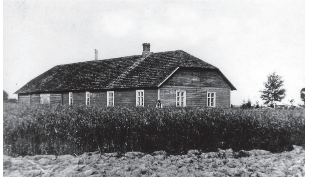
Võhma kool asus selles, 1888. a ehitatud majas Tartu tn 10, kuni 1911. aastani.