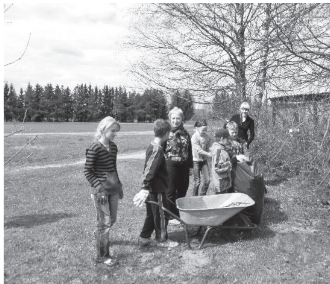
Teeme ära!