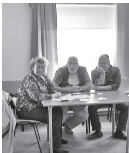
Tiiger ja jänesed.