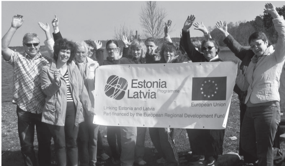
Olgu tervitatud Eesti-Läti!