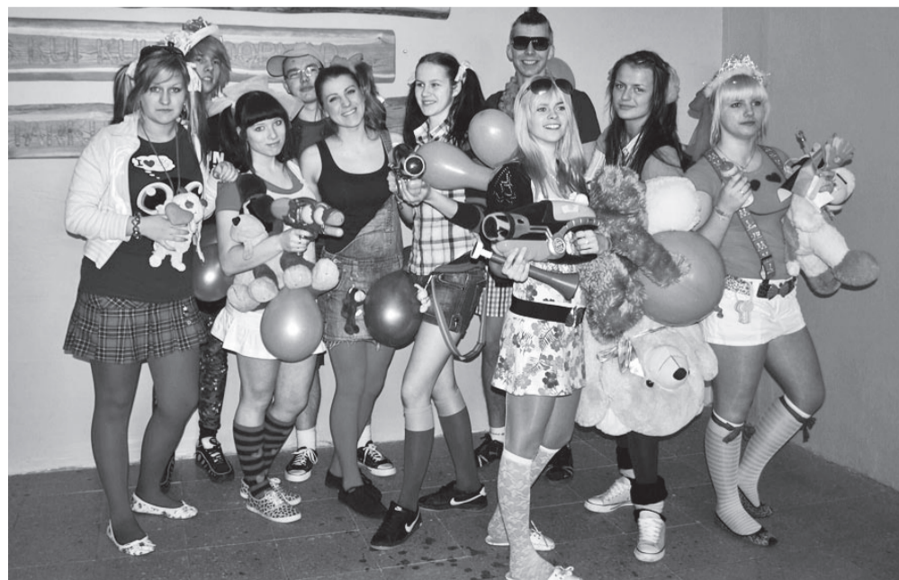
12. klass lustib oma viimasel koolipäeval