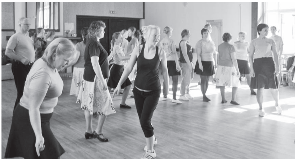
Tants ühendab meid, lähendab meid.