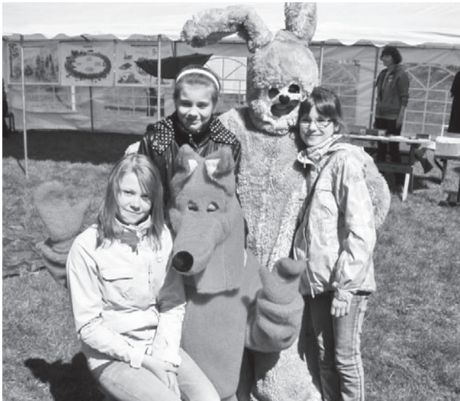
Meie edukad lauluautorid/lauljad Haapsalus (metsapealinn 2011) autasusid vastu võtmas