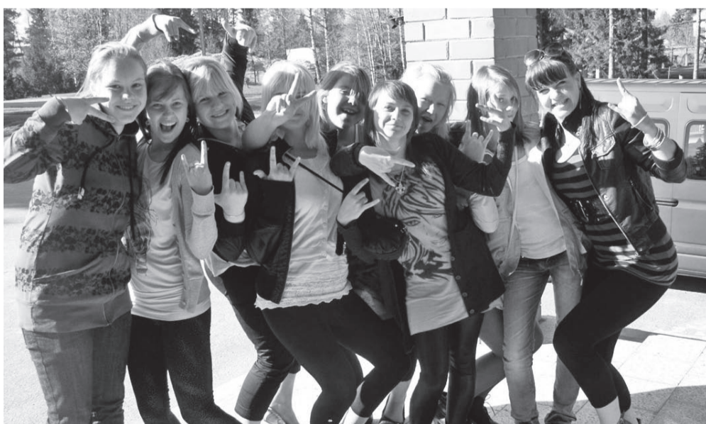
Säravate silmadega noored soovivad tantsujalgu seada.

huumorit, positiivsust ja empaatiat. Treeningpäeva lõpuks oli loodud tants, milles igal grupil on oma roll. Siin sai endale kõige enam liikumisvärskust nõudva osa noorte tantsijate rühm.