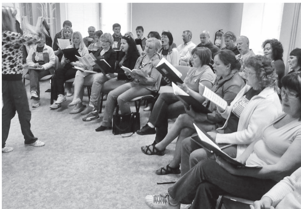
Stendekad ja leelokad lihuvad kokkulaulmist.

29. mai hommikul toimus Viljandi Muusikakooli kooriklassis veel viimane kokkulaulmine enne suure peo algust ja kell 15.00 laulsid juba Stende lauljad puhtas eesti