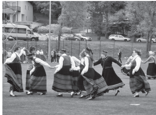
Lillekesed Viljandis jalga keerutamas.