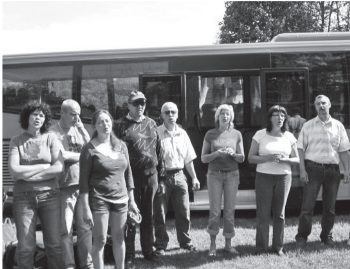
Aeg on lahkuda, et saaks kord jälle kohtuda.