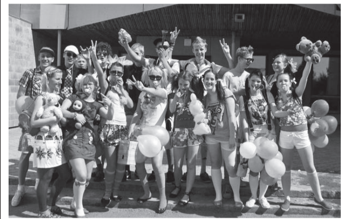
9. klass lõbusas tutipeotujus ...

Selle aasta kevadeks on põhikooli lõpuklassi õpilastel kogunenud seljakotti üheksa koolialve tarkused. Lisaks sellele mahub sinna hulk mälestusi üritustest, millest koos osa võetud, saavutused, kogemused ühistegevustest, rõõm koosolemisest.