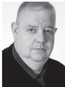
Markus Stein Viljandi õppekeskus

Erakõrgharidusest kõneledes kohtab ikka aegajalt seisukohti, et see on kuidagi viletsam riiklikust. Kui nüüd korraks laskuda eralasteaia ja erakooli tasandile, siis kõik lapsevanemad tahavad, et nende lapsed saaksid samasugust personaalset kohtlemist ja head õpet riiklikuski institutsioonis. Seega ei maksa karta ka erakõrgharidust, mis on oma sisus andnud Eesti kõrgharidussüsteemile palju juurde, sest just paljudest erakõrgkoolide lõpetajatest on saanud meie ühiskonnas olulisel positsioonil olevad ja hästi hakkama saavad inimesed, mis on kahtlemata kvaliteedimärk. Ka mujal Euroopas ja maailmas on erakõrgharidusel kindel, välja kujunenud ja arvestatav koht. Seetõttu väärribki erakõrgharidus ka Eestis võrdset kohtlemist. Erakool on rohkem sõltuv olukorrast tööjõuturul, avalikust arvamusest ja mainest, mida kujundab juba kooli enda üliõpilaste ja viislaskond, kuid eelnev ei tähenda, et kehvem. Oleme lihtsalt konkurendid. Targad konkurendid õpivad üksteiselt. Erainstitutsioon on alati kiirem ja paindlikum. Mitmekülgne turg on üks kvaliteedi tagajaid, sest