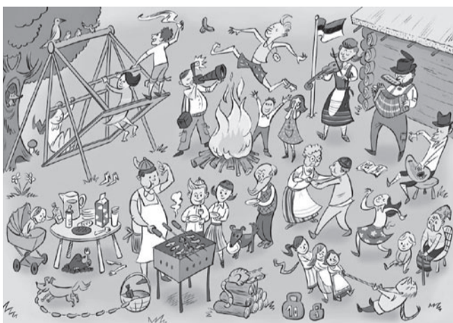
Autor Joonas Sildre.

Väga palju upub suvisel ajal Eestis nooremageid mehi ja põhjuseks on sageli alkohol ja oma võimete ülehindamine. Traagiliste õnnetuste vältimiseks on lihtne reegel: kui jood, ära uju ja ära lase purjus sõpra vette! Samuti ära mine ujuma üksinda, kui lähed vette, ütle seda oma kaaslastele.