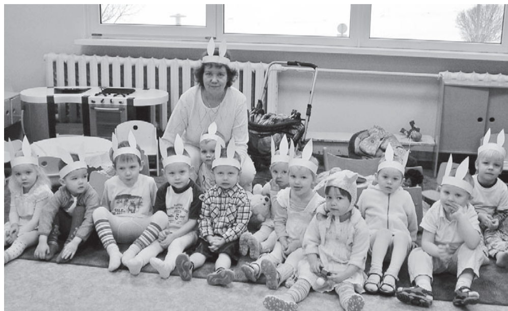
Väikesed Rukkililled hakkasid jänkudeks.

Toimus ka kevadine spordipäev, kus vanemad rühmad katsusid jõudu mitmetel spordialadel nagu pallivise, võidujooks ja kaugushüpe. Teatri töi kohapeale Rahvusvaheline Nukuteatri Festival „Teater kohvis“, kus nukuteater „Kehra nukk“ mängis etendust „Okasroosike“.