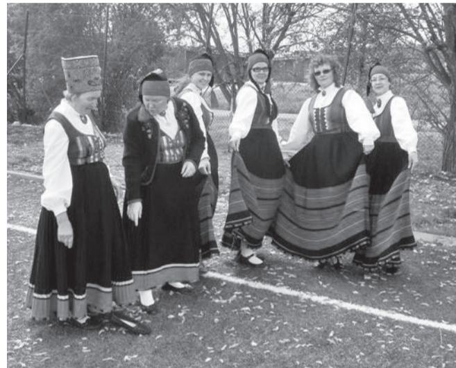
Tantsijale soovitakse tavaliselt „okas päkka“. Seekord on hoopis „kivi kingas“