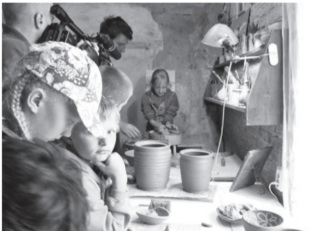
Keraamikatöökogas oli meie külaskäiku filmimas Talsi televisioon.