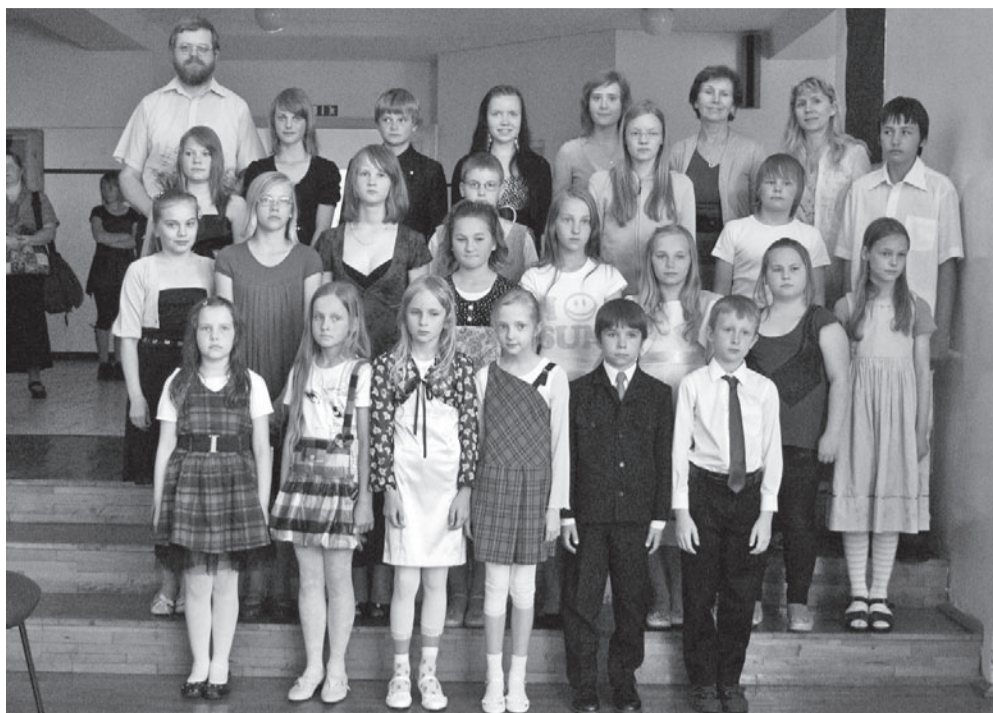
Võhma Muusikakooli õpilased ja õpetajad.

Mais-juunis oli muusikakooli laululastel mitmeid esinemisi oma koolis. Küläs