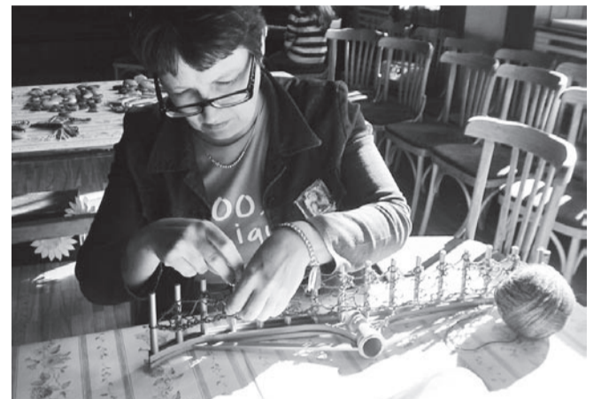
Rehaga kudumine on sama lihtne kui riisumine.

Järgmised taolised käsitööpäevad toimuvad aasta pärast Võhmas. Seni on aega pisikut levitada nii suurte kui väikeste hulgas.