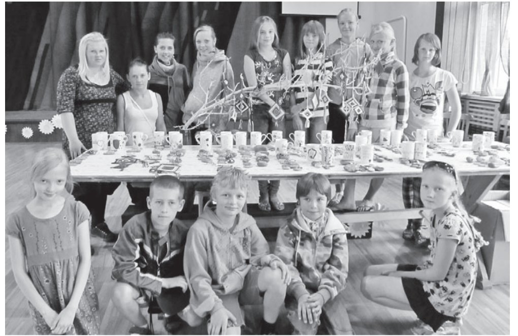
Stende ja Võhma lapsed ümber näituselaua.

Viimane hommik Lätis kulus Talsi linnaekskursioonile, mis küll kahjuks lõppes suure vihmasajus. Veel päiksepaistelisel magajõudsimise ära käia meie eelmise päeva õpetaja Antra kodus. Punapäine tekstiilikunstnik elab nagu Pipi vanas kollases puumajas. Seal näitas ta oma töövahendeid, mis olid üsna sarnased eelmisel päeval kasutatutele, saime ringi vaadata ka pipilikult lõbusas koduaias. Linnamuuseumi külastamise järel kiirustasime juba tugevnevas vihmasajus keraamikatöökotta, kus kõigepealt tutvustati savitöötlemise tehnoloogiat ja siis sai igaüks savi oma kätega voolida. Ega see nii lihtne materjal polnudki, aga varsti kogunes julgetest järjekord ka potikedra taha, et oma