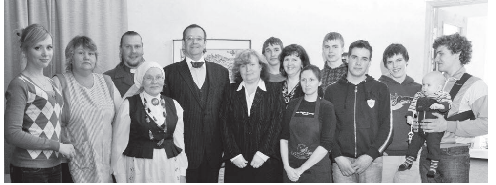
Vabariigi president külastas kogudust 2009. a. 26. märtsil märtsiküüditamise 60. aastapäeval.

Pilistvere kirikumõis oli 964 hektarit. Kogudusel oli enne nõukogudeaja algust 17 hoonet, millest 11 hävitati. 1941. aasta nõukogude armee taandumisel sakslaste ees musta maa taktikaga süüdati meie koguduse Risti abikirik Imaveres, 1960-ndatel tõmmati maha mädanema jäetud pastoraat. Omamoodi ime on olnud ajaloolise pastoraadi