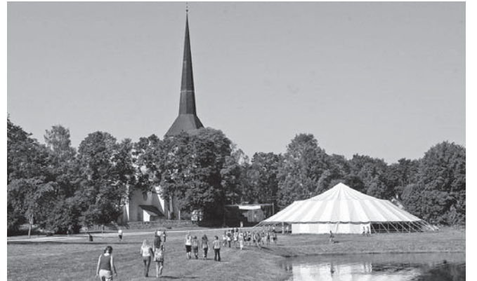
Pilistvere toob kokku noori lähedalt ja kaugel.

Kogudus vaatab sama murelikult tulevikku nagu ilmselt suurem osa inimestest kogu maailmas. Kuid kindlasti hoopis erinevatel põhjustel, kui hetkemured mõista