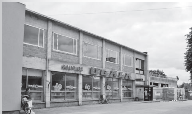
Enne Ugala

Võhma Konsum avati senise Ugala A ja O kaupluse asemele ning vanale kauplusele ehitati juurde 600 ruutmeetri laiendus, mille abil suurenesid nii müügisaal kui ka tagaruumid.