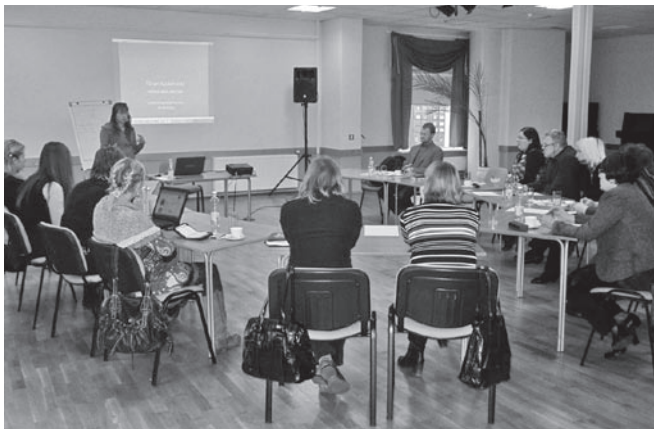
Osalejad õpivad õppepäeval alkoholiprobleemide ennetamist.

Eesti Karskusliit on alates 2005. aastast teostanud koostöös erinevate organisatsioonidega ISE projekti, mille keskmeks on 2-kuuline võistluslik ja meeskondlik noortemäng, kus läbi aktiivse osaluse õpivad 7. ja 8. klassilised lapsed alkoholi- ja