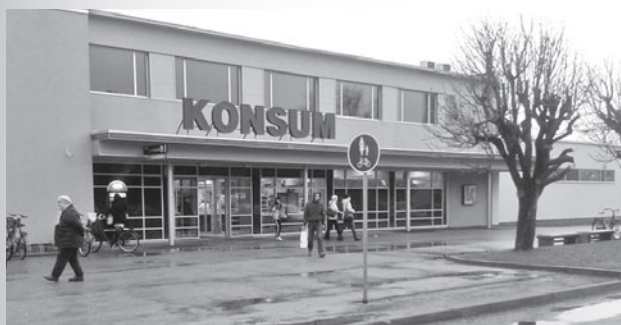
Nüüd Konsum