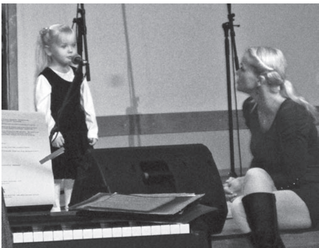
Kui esimesel korral laulma hakkasin, võtsin ema kaasa.