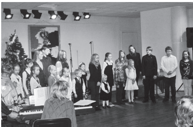
Kontserdi finaalis kogunesid väikesed ja suured laulusõbrad veel kord lavale.

Uude aastasse kui astud, õnn Teil naeratagu vastu. Hoidke kinni tema käest, et ta Teie juurde jääks.