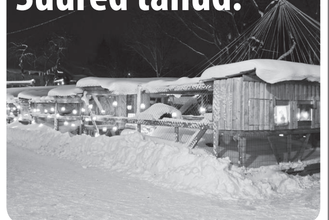
Meenutame eelmist jõululaata pildis.

Kuna suur väsimus on nüüd juba selja taga, on just kõige hetk teha kokkuvõtte jõululaadast.