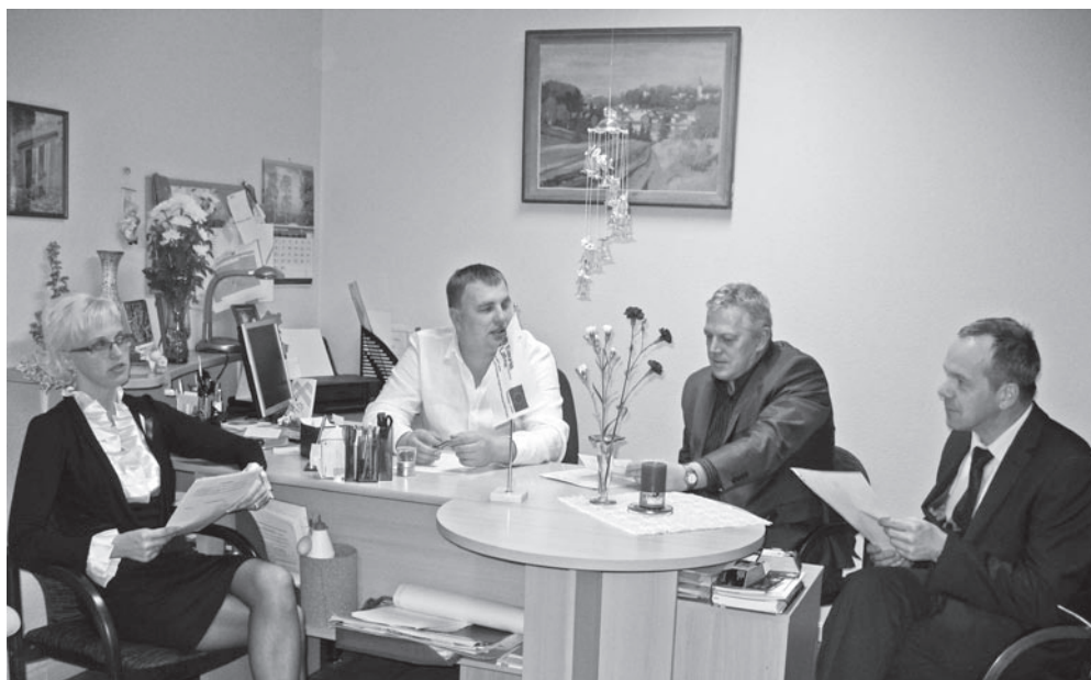
Projektipartnerite kohtumise raames arutati edasisi plaane.

Samuti tänati tublimaid linnakodanikke, kes erilisel on linna arengule kaasa aidanud. Ka see oli läbi mõeldud punktuaalse täpsusega.