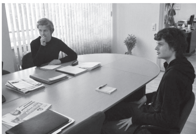
Vallavanem Palmi kabinetis.

Pärast seda suundusime tagasi Pärsti vallamajja, kus tegime päevast kokkuvõtte ja jagasime muljeid. Leidsime, et vallavanem on oma töös nagu Hunt Kriimsilm, kes peab väga erinevatest