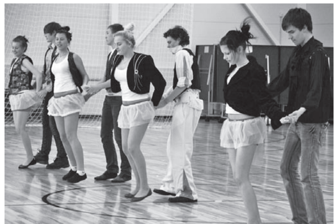
Heas rokihoos oli 9. klass.