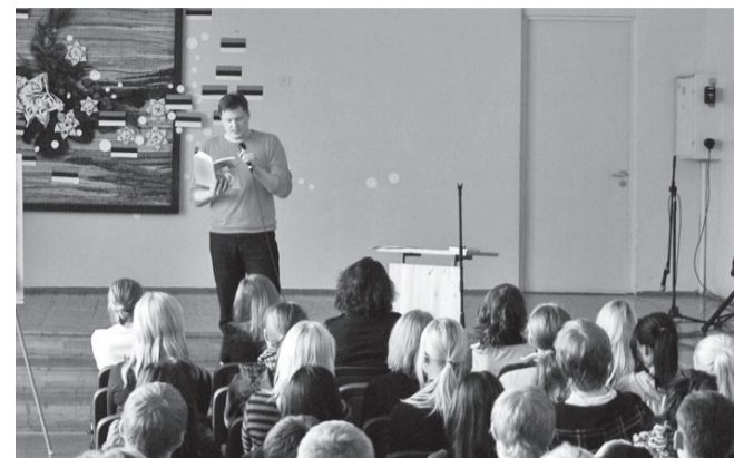
Muud juttu rääkis Wimberg puldist, aga luuletusi ei saa lugeda, kui laud on ees.

tundjad – gümnaasiumiõpilased kõigest Viljandimaa gümnaasiumidest kogunesid koos juhendajatega meie kooli, et selgitada õigekirjavõistlustel välja maakonna parimad õigekirjatundjad ja