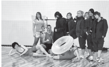
Võidukas aeroobikatiim (foto Kenno Soo)

Pingelises heitluses esikoha eest armu ei antud ja