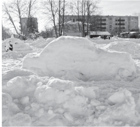
Leia pildilt auto!