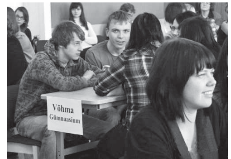
Meediamulli võistlustules

Õpilaste silmaringi testiti mitmesuguste küsimustega, oma teadmisi tuli näidata ajaloo, geograafia, muusika, kirjanduse ja muidugi meedias kajastatu tundmise vallas.