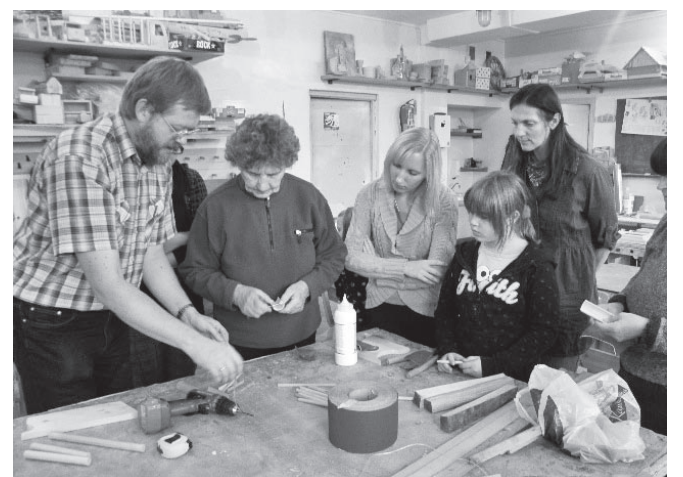
Kõigepealt valmistati pillid.