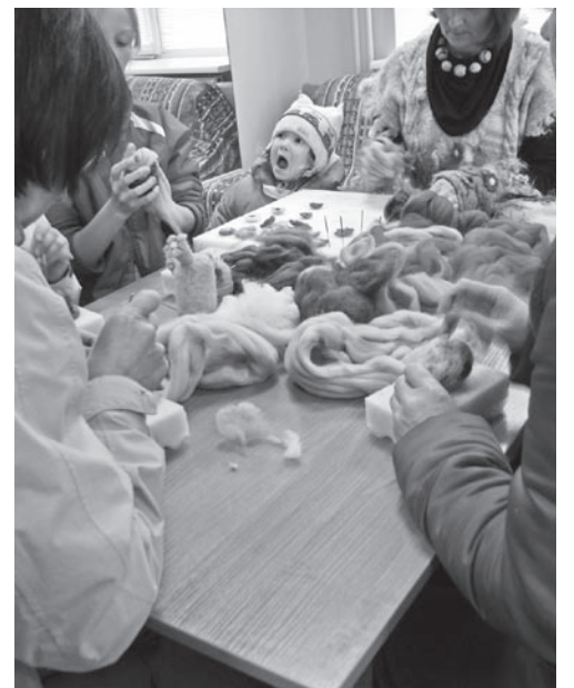
Nõelvilgimise töötoas käis vilgas tegutsimine.

Kahjuks kippus meid kõiki ilm alt vedama, aga need väiksemad ja suuremad vihmavalingud andunud aiarahvast tavaliselt eriti ei heiduta. Taimesõpru ning -uudistajaid oli kohale tulnud Tallinnast Võruni ning Pärnumaast Peipsini.