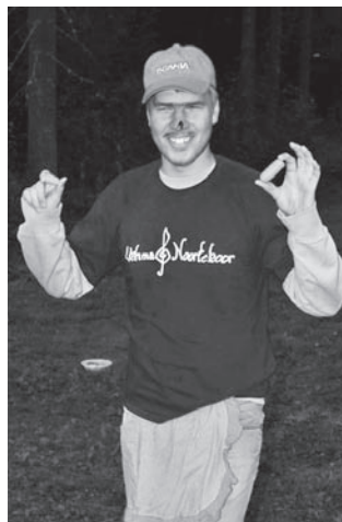
Rõõmus rebane poolekslänud porgandiga.

Ristitud rebased, kes andsid vande, mida nad ei täida! (10. klass)