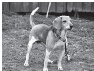
Eesti hagijas - jahimehe sõber.

Kalapüük on kalanduse haru, mis keskendub kalade ja teiste veorganismide püügile mingist vee kogust. Kalapüügiks võib tarvis minna spetsiaalset kalapüügiluba ning tuleb olla teadlik teatud hooaegadel kehtivatest piirangutest mõningate kalaliikide püügil. Suveperioodil piirangud praktiliselt puuduvad. Täpsemat infot saad kalastus- ja matkapoodidest.