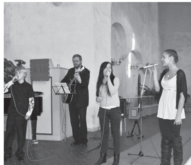
Võidulaulu esitamas.