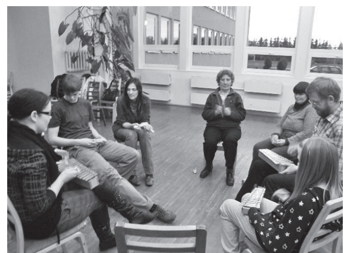
Ja seejärel harjutati kokkumängu.