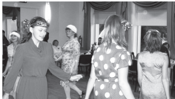
Kergejalgsed "lillekesed" lõbusas tantsuhoos.

Mälumäng 1x kuus pühapäeval Sasku igal pühapäeval kell 14.00 Male esmaspäeviti kell 18 konverentsisaalis Pühapäeviti pühapäevakool konverentsisaalis ja ringiruumis Üle nädala laste pühapäevakool suures saalis