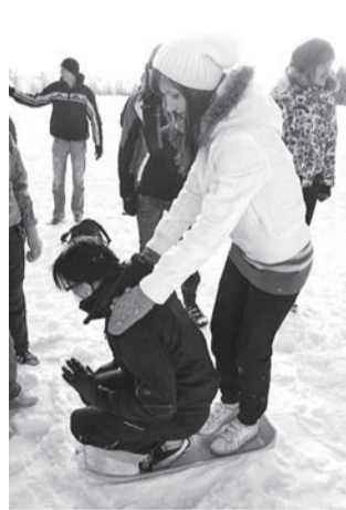
Õlamassaaž koos kelgutamisega

Vastlapäeva traditsioonilised talispordivõistlused toimusid 16. veebruaril. Kooli mäel võeti mõõtu teatekelgutamises, pikima liu laskmises ja eriülesandena stiilikelgutamises. Kõigil olid võrdsed võimalused, sest liulaskmiseks olid kasutusel kooli salvokelgud. Näha sai nii huvitavaid kostüüme kui ka huvitavaid kelgutamisasendeid.