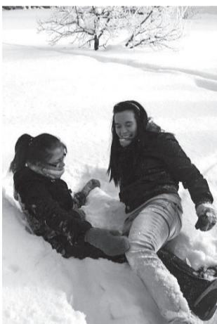
Kuhu meie kelk jäi?