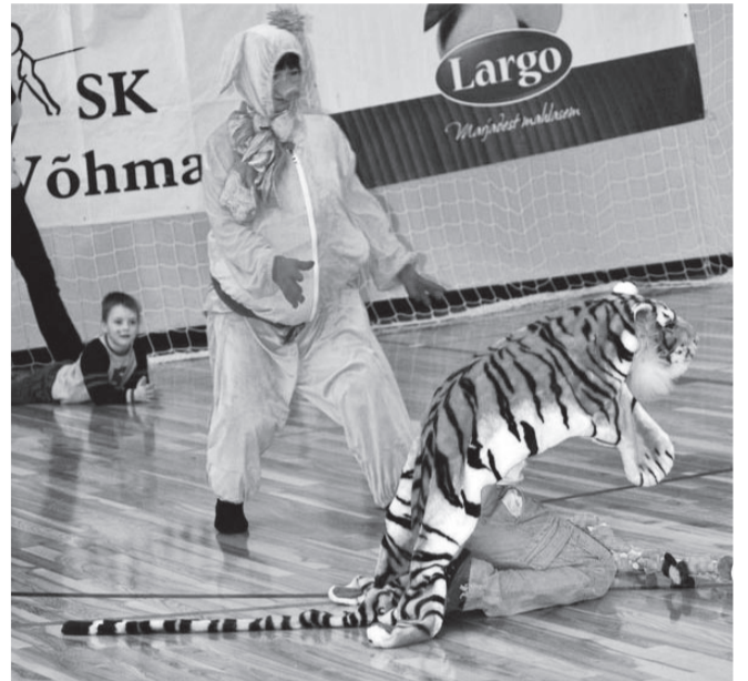
2. klassi loomade limbo