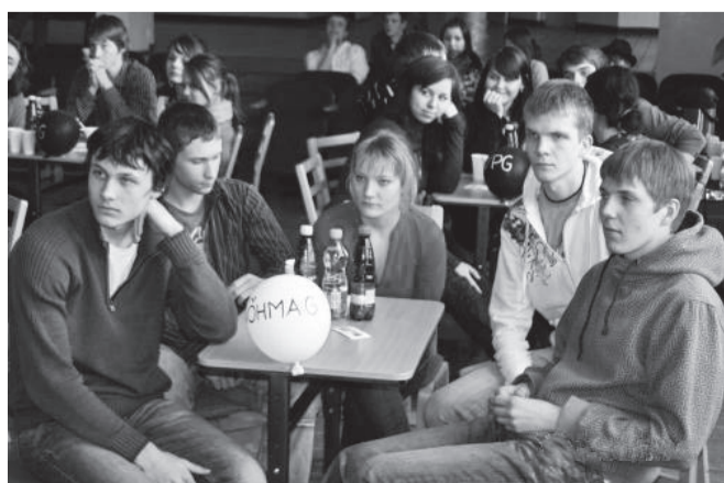
Meie võistkond meediamulli finaalis

11. veebruaril toimus Viljandi Jakobsoni nimelises gümnaasiumis meediamulli II voor, kus võistlustules olid üheteistkümnenda klassi meediamullitajad. Võitis Paalalinna kooli võistkond ja Võhma esindus jäi seegi kord neljandaks.