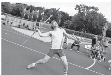
Hannese visketechnika tõi tubli tulemuse - esikoha!