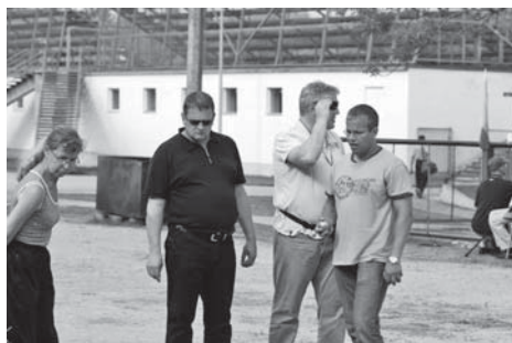
Petank nõuab täpsust ja osavust.

26.-27. juunil peeti Rakvere kaasaegses spordikompleksis Eesti linnade 41. suvemänge, millest võtsid osa ka Võhma linna sportlased.