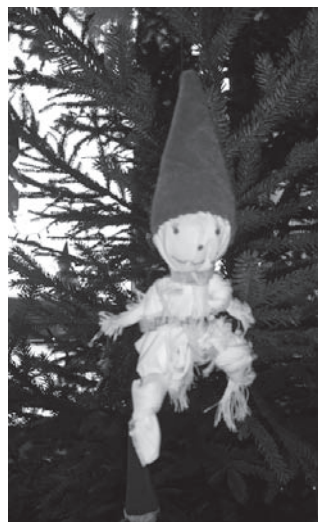
Selliseid tegelasi rippus kooli jõulupuul 101.

Kotkad hoos Jõulukuu pildis Omaloomingut Ja palju muud