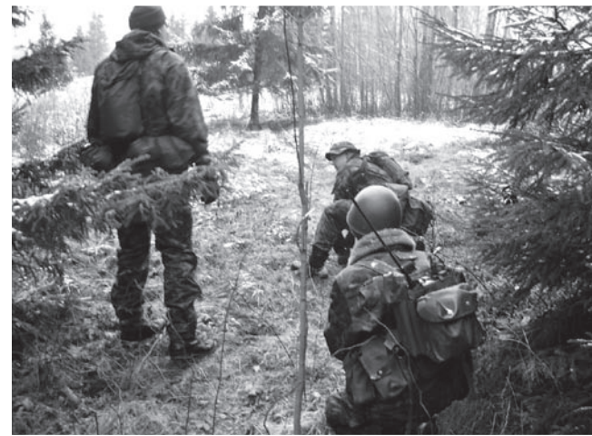
Noored kotkad sõjamängus.

väike paus ja õhtul algas ball, kus praktiseeriti päeval õpitud. Vahepeal, kui tantsimine liiga ära väsitab, lauldi karaoke. Kosutuseks söime oma võileivatortide ja muud nänni. Siis tantsiti veel natuke. Pühapäeval õpiti muusika saatel marssimist, line-tantsu ja rahvatantsu, seejärel lõunatasime, koristasime ruumid ja järgnes kojusõit.