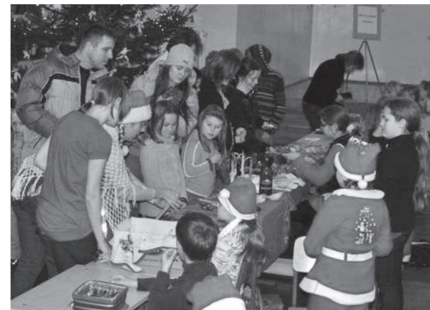
Jõululaadal läks lettide ääres trügimiseks.