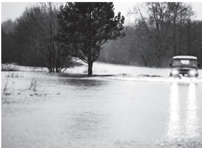
Üleujutus on Soomaal oodatud (Foto internetist).

Hea ja lihtsa veetõkke ehitamiseks saab kasutada puidust laadimisaluseid. Laadimisalused paigaldatakse (ca 45-kraadise nurga all) üksteise kõrvale selliselt, et tekiks vajalik barjäär, mida toetatakse puidust või