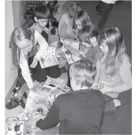
Lugeda sai kambaga.