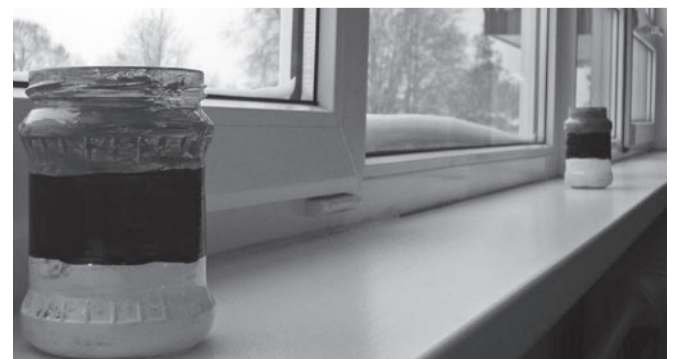
Laste maalitud küünlahoidjad.