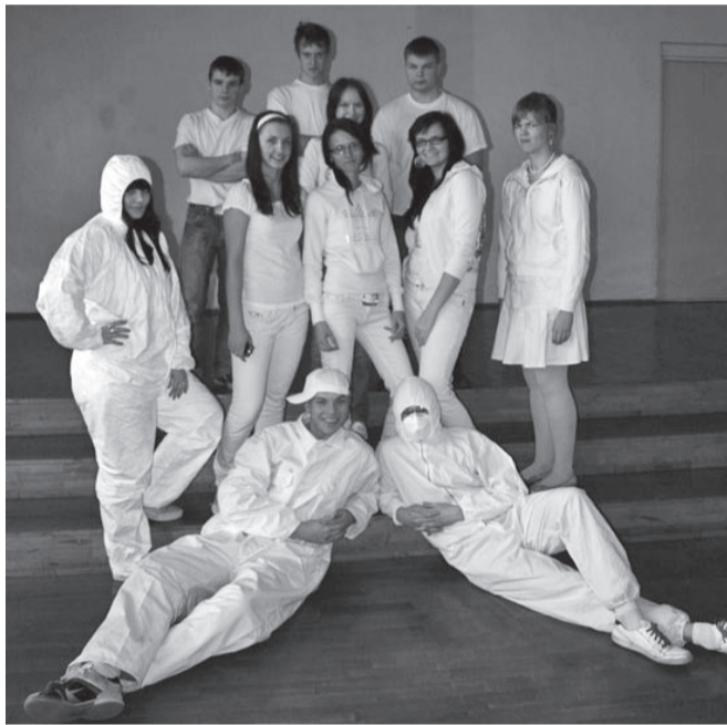
Valgendatud 12. klass