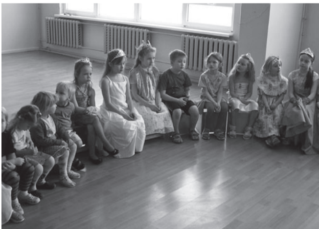
Külas on printsessid.