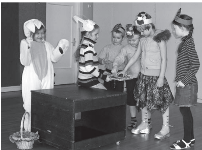
Jäneseema pakub porgandipirukaid.