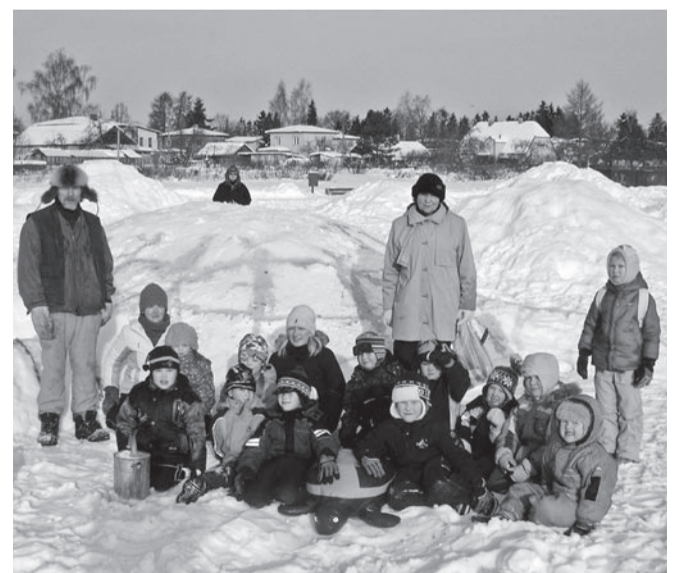
Lumelinna Kilpkonna osakond.