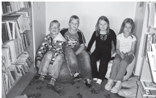
Kardo, Kert, Egle ja Cetlin raamatukogu lugemispeas.

E simese klassi lapsed on juba nädal aega koolis käinud kui saan nendega juttu puhuda.