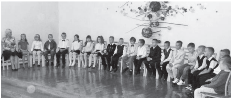
Esimene koolipäev.