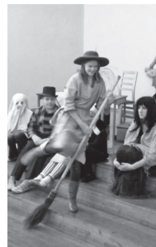
Iika asutab lennule.