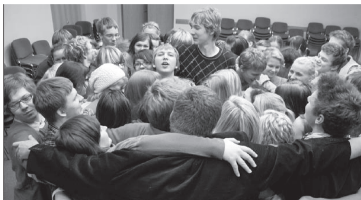
Noorte meediaalaagri suur kalli. Kes siis veel.