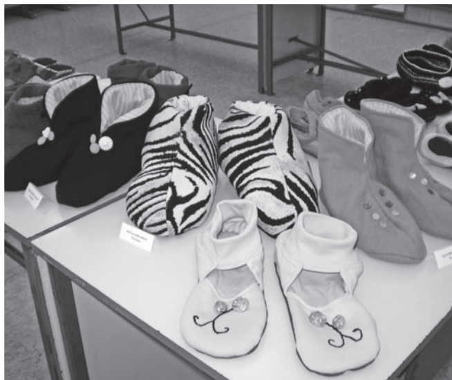
Soojad ja lõbusad sussid.

Peale kooliõpilaste valmistatud susside võis seal näha ka kultuurikeskuse käsitööringi näputööd. Ma arvan, et selle tore näituse eest tuleb öelda suur aitäh