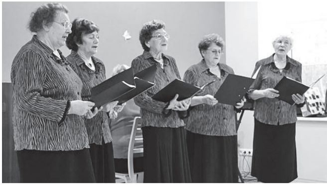
Tervitused Võhmast.