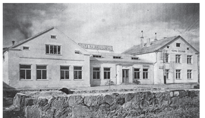
Võhma Majandusühisuse 1933. a ehitatud kauplus.