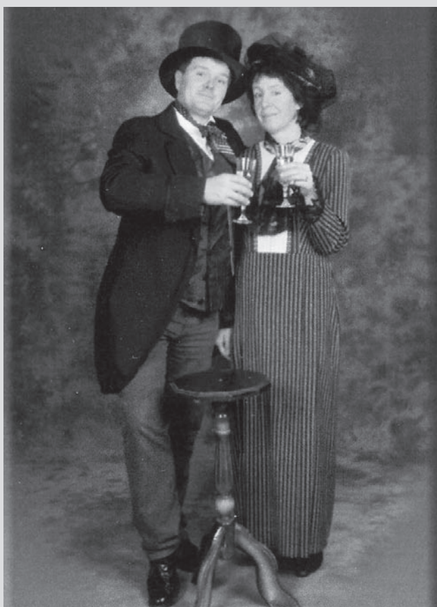
On olemas 10 kuldset reeglit edukaks äriks ...