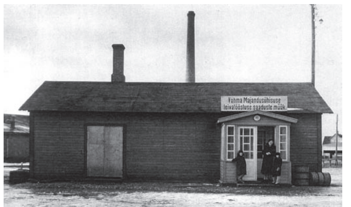
Võhma Majandusühisuse leivatööstus.