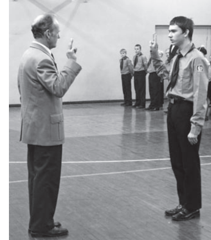
Pidulikuks rivistuseks valmis!

06. detsembril olid Võhma noorkotkad ja Kalmetu kodutärred jällegi metsas, kuna toimus kogunesime kell 8.00 meierei juurde, kus ja-gasime välja toiduained ja muu varustuse ning retk sai alata. Juhid ja väiksemad noorkotkad