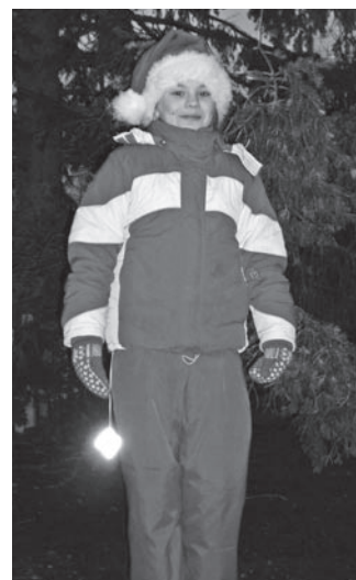
1. advent Võhmas.

17. detsember. Laulsime talve- ja jõululaule lasteaialas- tele ja Pilistvere Hooldekodu asunikele.