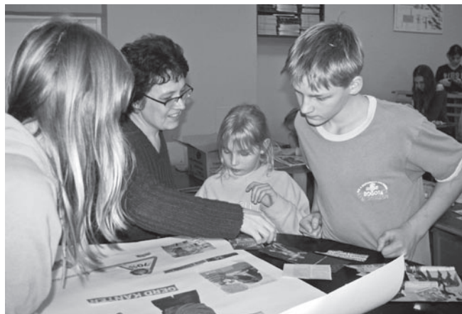
Meedia õpituba pani loovalt mõtlema.

Maire Juus Kalmetu kodutärde rühmavanem