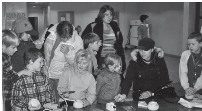
Põletustöö on põnev.