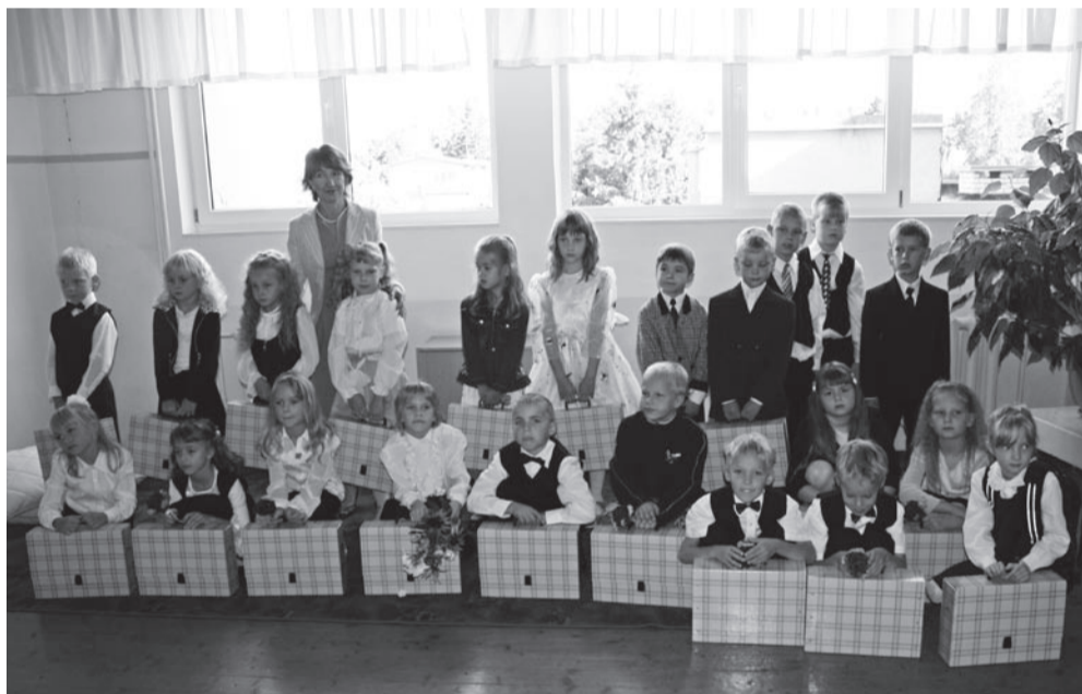
Esimene klass on pikaks kooliteeks valmis