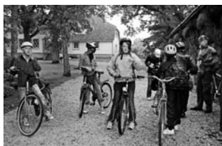
Jalgrattamatk Viljandi maakonnas.