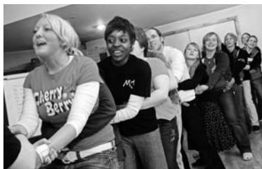
Rahvusvaheline noortejuhitide laager.