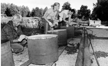
Teeme prügikaste järveranda.