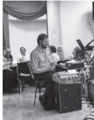
Mait – mees nagu orkester.