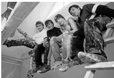
Ehitame noorte- ja lastetuba!