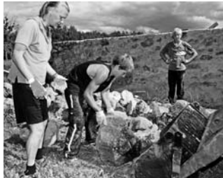
Noorteprojekt: maal on mõnus!