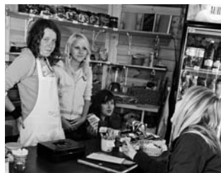
Suvekohvik "Ingel" ja meie inglid.