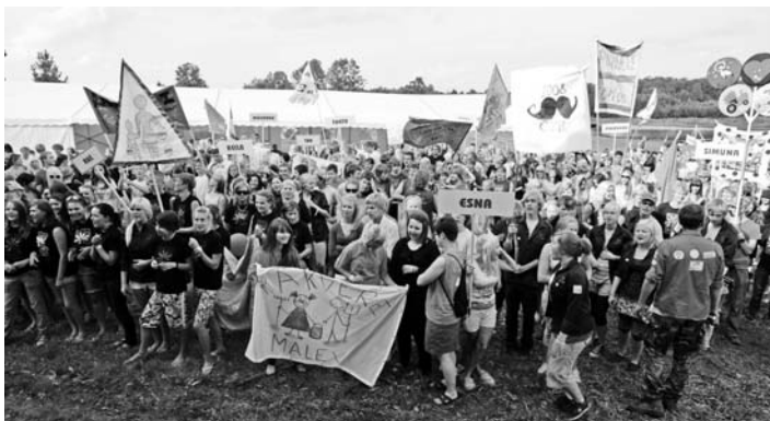
ÕM 2008. a kokkutulek.

Noortetöö sai projektiraha nii Viljandi maakonnalt kui ka Põllumajandusministeeriumilt. Kihelkonna noorte kaasabil valmis pastoraadimajas laste- ja noortetuba ning suve jooksul tegime paremaks järveäärset ranna-ala.