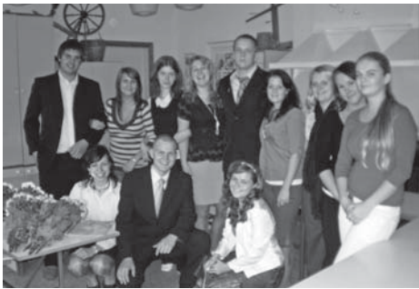
Röömsad õpetajad peale väsitavat päeva.

Reedel, 3. oktoobril toimus Võhma Gümnaasiumis õpetajate päev. Kõigile 12. klassi õpilastele anti võimalus ennast proovile panna õpetajana.