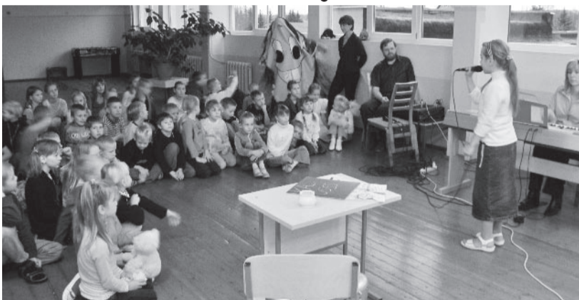
Krõlli sünnipäevale kogunes toatäis lapsi