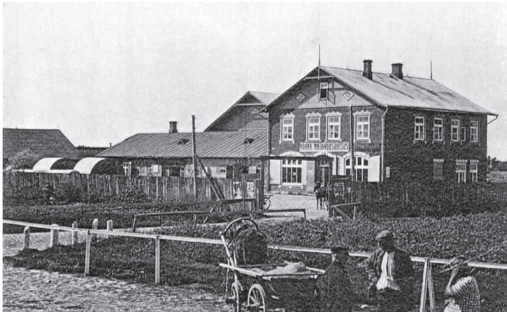
Võhma Majandusühisuse hooneid 1920-ndail aastail.