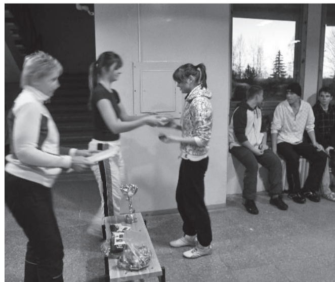
Auhindu jagus seekord kõigile, ka fännidele