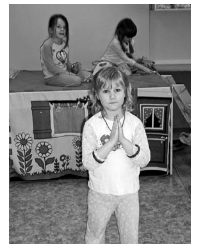
Vesikisellid tagasi vastremonditud ruumides