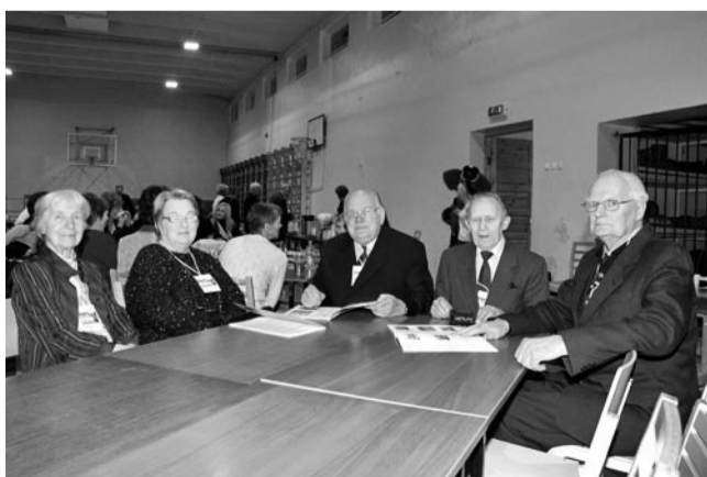
Türi Rahvaleht.