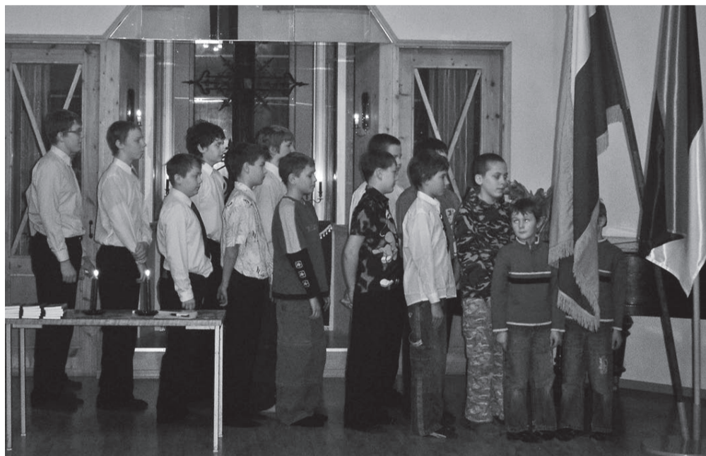
Parem pool, samm marssi!