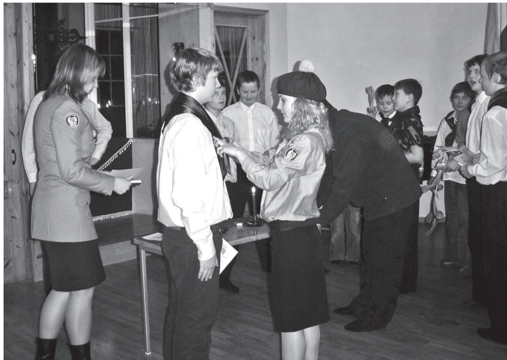
Noorkotkad vannot andmas