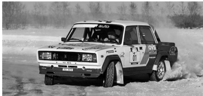
Rabaliiga 3. sõit 03. veebruaril 2007

Minu hobi sai alguse 2 aastat tagasi, kui läksin osalema Võhma kohalike poiste organiseeritud jäärajavõistlustele.