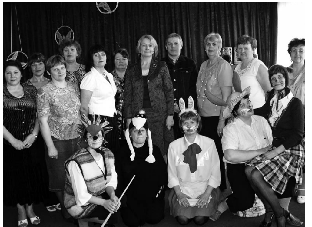
Enne lahkumist lasteaiaast