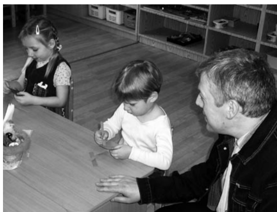
Aare väikeste stendelastega