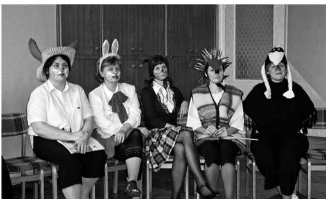
Lasteaiaõpetajad ootavad oma etteastet