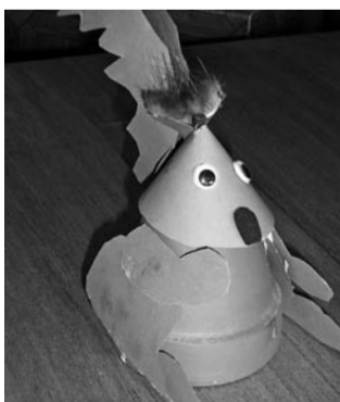
Koostööna valminud lillepotist orav