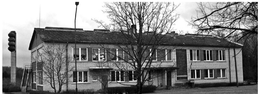
Stende lasteaed Saulite