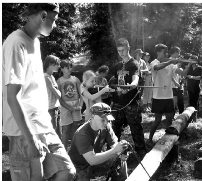
Kindlat kätt ja täpset silma