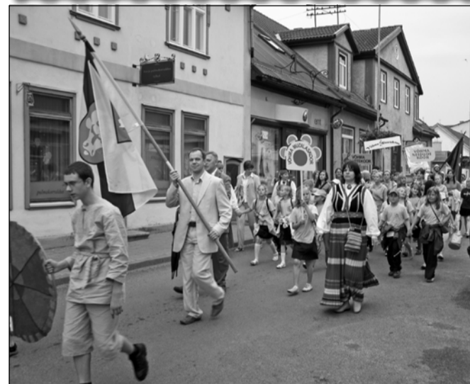
Võhma Linnavalitsus tänab koorijuhte, lauljaid, sportlasi ja kõiki, kes esindasid Võhma linna Sakala Mängudel ja aitasid kaasa linna heale esinemisele nii spordiväljakutel kui laulupeol!

Ilusat sooja suve ning huvitavat puhkust!