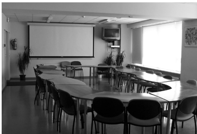
Kadestamist väärt Väike-Maarja raamatukogu õppeklass